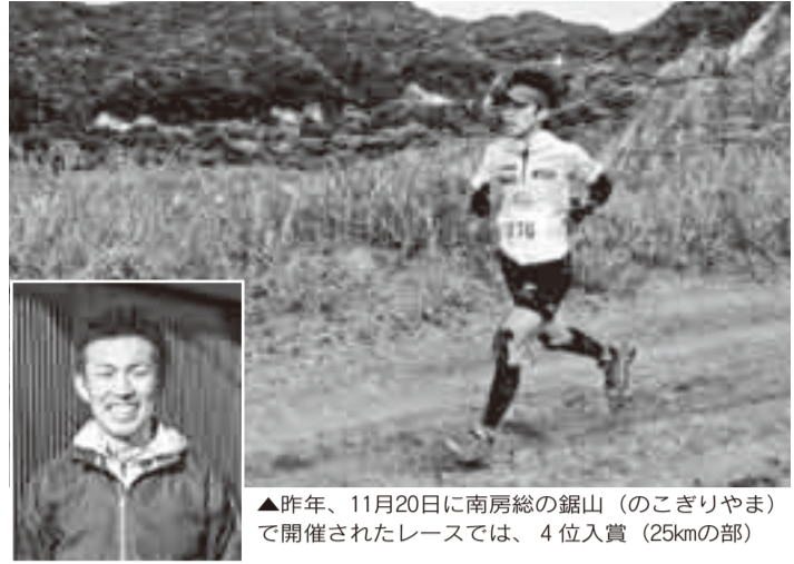
▲昨年、11月20日に南房総の鏡山(のこぎりやま)で開催されたレースでは、4位入賞(25kmの部)