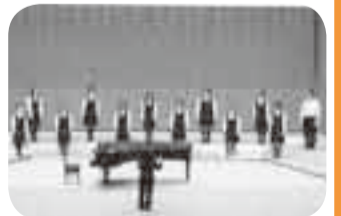
▲ステージでは全身全霊!

音楽部は、2005年千葉きらめき総体で、選抜合唱団に選ばれCD収録。幕張メッセにおいて開会式合唱をしました。昨年12月2日の創立110周年記念式典の時は、全校生徒による大合唱の中心として活躍。2月11日には、千葉県合唱連盟50周年演奏会に、高校合同(7校)で出演します。