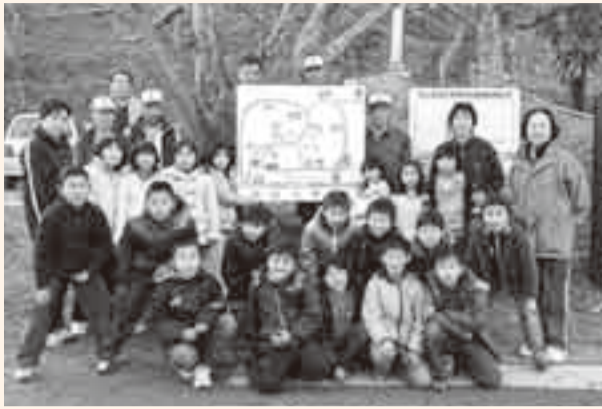
▲力作の地図を囲んで記念撮影

津宮小学校3年生19人の児童から神道山ボランティアクラブへ手作りの神道山の地図が贈られ、1月13日に児童たちをも手伝って、神道山の入口に設置されました。