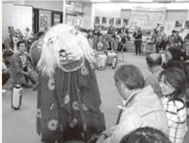
▲多幸を祈願し、観衆の頭上で「カブツ」

五穀豊穡を占う祭事「御花祭り」と射手の儀が、大戸神社で行われました。神前で調理された鯉が、2人の射手の前に差し出されると、射手は境内に設けた的に向かって、次々に矢を放ちます。この矢の当たりによって豊凶が占われるため、張り詰めた空気の中、厳格に執り行われました。