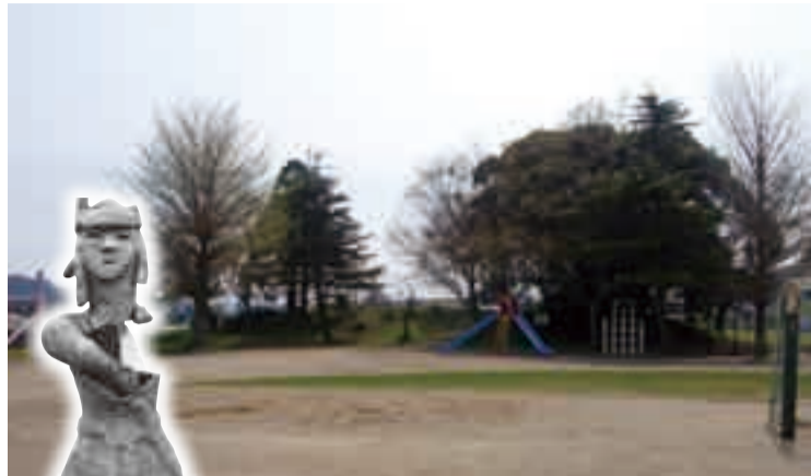
▲富田1号墳と武人埴輪

富田1号墳は、小見川北小学校の敷地内にある前方後円墳です。同校の校歌に「むかしを語る木立の塚」と歌われ、児童からは「塚山」と呼ばれて、古くから親しまれてきました。古墳の規模は、全長39m、後円部径20m、前方部幅21mで、高さ2.5mです。明治33年(1900)に発掘調査が行われ、形象埴輪(武人・馬・犬・鹿)や円筒埴輪などが出土しました。しかし、それ以降、正式な発掘調査が行われたことはなく、埋葬施設や副葬品は、現在のところ不明です。