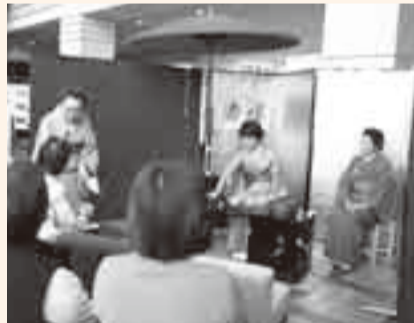
▲小見川文化祭 (11月2・3日、8・9日)