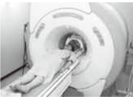
▲MRIなどの導入により高度な医療を提供

てきました。しかしながら、病院事業経営を取り巻く状況は年々厳しくなり、特に本年4月からの患者数の減少が予測を超えるなどにより、経営が逼迫した状況が続いています。このため、病院事業を運営する香取市東庄町病院組合では、10月9日開催の病院組合定例会において、経営改善策の一つとして職員の給与5%削減などの経営改善計画を決定しました。しかし、改善計画にある人件費削減等改善額を充てても、本年度末には約