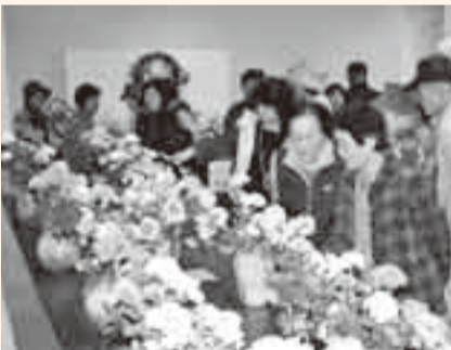
▲山田文化祭 (11月2・3日)

市民の文化芸術活動を紹介する佐原・小見川・山田文化祭が各地で開催され、絵画や書道、生け花などが展示され、訪れた人たちは力作を賞しました。また、佐原文化会館や山田公民館では、音楽会や芸能発表が行われ、来場者は芸術の秋を満喫しました。