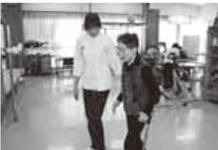
▲明るくて広い訓練室での歩行訓練

1億6400万円もの資金不足が見込まれ、年度内に回復することは困難な状況となっております。このことから、病院組合から構成市町である香取市、東庄町に対し追加負担金などの要望が出されており、構成市町でも救急医療などの地域医療を守るため、今回の事態に緊急に対