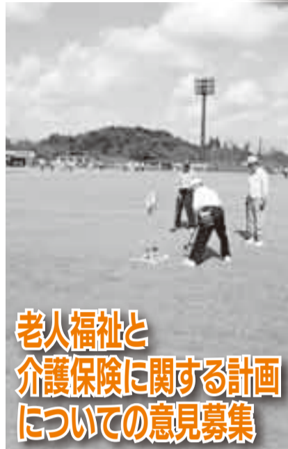
老人福祉と介護保険に関する計画についての意見募集

香取市パブリックコメント制度に基づき、「老人福祉と介護保険に関する計画」と「環境保全などに関する計画」に対する意見を募集しますので、ご意見をお寄せください。