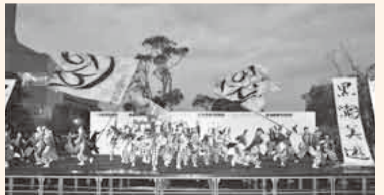
▲優勝した「黒潮美遊」の華麗な演技

おみがわYOSAKOI 2008が11月9日、小見川区事務所をメイン会場に開催されました。5年目を迎え、26チーム約1000人の踊り子が集結した今大会は、水郷おみがわふるさとまつりと同時開催されたこともあり、例年以上の人出で賑わいました。