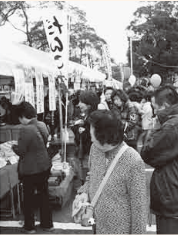
▲模擬店には特産品などを求める人が並ぶ(小見川) ステージでは、みんなが注目する中、当選者を発表(山田)▶

秋恒例となった香取のふるさとまつりの先陣を切り、山田ふれあいまつりが11月3日、水郷おみがわふるさとまつりが9日、それぞれの区事務所を中心に行われました。会場は、地元特産品や秋の味覚を販売する模擬店が立ち並んだほか、特色のあるイベントが行われ、多くの人たちが訪れました。山田ふれあいまつりでは、特産品をはじめとした商品が当たる大抽選会が行われ、大勢の人が抽選を見守りました。