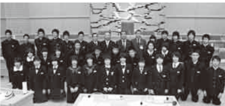
▲閉会し、緊張も和らぎ笑顔で記念撮影

閉会の後、市長は「ドキッとするような取穂のある質問でした。いろいろなことに疑問を持つことは大切です。多くのことにチャレンジして大きくなっていただきたい。期待しています」と激励しました。