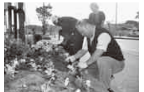
▲活動に参加し、一緒に汗を流す市長