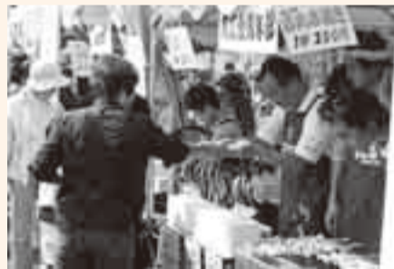
▲歯切れの良い掛け合いに消費も拡大

小見川区事務所駐車場10月5日、「小見川藩商人街はんなり市」が開催されました。 会場には、地元商店街をはじめとした各種の模擬店が所狭しと立ち並び、朝から大賑わい。 特設ステージでは、小見川中央小学校子ども芸座をはじめ、小見川吹奏楽団によるブラスバンドライブ、曲芸コメディアンによるパフォーマンスによるダンスライヴなどが披露され、詰めかけた観客を魅了しました。