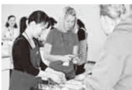
▲外国人を対象とした料理体験

現在、会員は個人105人、法人5団体ですが、その多くは佐原地区の人となっています。そこで、同協会は、幅広く会員を募集