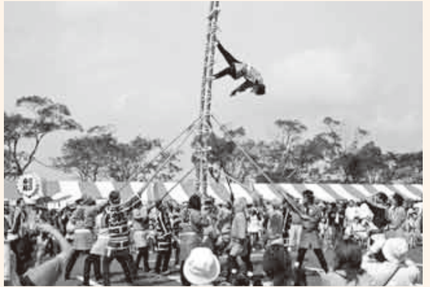
▲江戸の火消しの面影を今にとどめる「はしご乗り」。小粋な演技は絶妙

香取市には、楽しいイベントや出来事が盛りだくさん。ここでは、そんなホットなまちの話題をご紹介します。