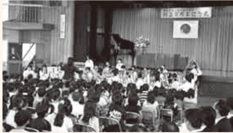
▲式典の前には同校音楽部の演奏が披露される