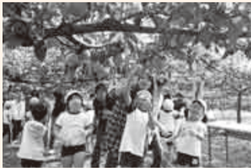
▲おいしそうな梨みい〜つけた

地域の子どもたちに地元秋の味覚の梨をもっと知ってもらおうと、佐原南部梨組合では、まんなまる保育園児とその保護者約30人を香取梨園の梨狩りに招待しました。 園児たちは実の取り方などを教わった後、おいしそうな梨を選んでもぎ取り、匂の味覚を楽しみました。