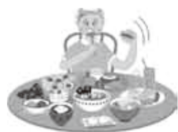
料理の作りすぎは、無駄な脂肪とごみを増やします

家庭から出るごみのことを「ごみ」を整理し、ごみ出す人「だけ」にまかせていませんか？ 家族みんなで、「ごみを出さない生活」を考えてみましょう。