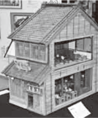
細部まで精巧に再現された店内 ▶