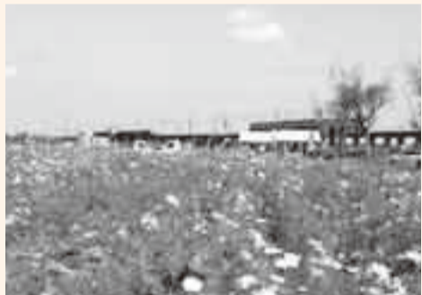
▲コスモスの花言葉は『乙女の純潔』

コスモスマつりが、与田浦十二町歩で開催され、一面に咲き乱れる色鮮やかなコスモスが訪れた人を楽しませました。 これは、与田浦を美しいコスモスで彩ろうとNPO法人香取市与田浦を考える会が始めたもので、今回で2回目となります。 この日、訪れた親子連れなどは、秋風にそよぐコスモスに囲まれて、憩いのひとときを過ごしました。