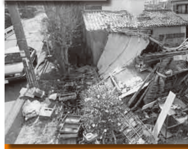
▲倒壊した建物など（阪神淡路大震災）