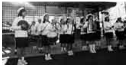
▲津宮小学校鼓笛隊の演奏

JR香取駅の新駅舎が完成し、12月24日に竣工記念式典が行われました。香取駅は、JR東日本と市が協力して整備したもので、香取神宮の玄関口として観光客を迎えるとともに、地元の人たちに親しみを持ってもらえるよう、朱色を基調とした香取神宮をイメージしたものとなりました。 記念式典では、安全祈願が行われたあと、地元の津宮小学校鼓笛隊や高齢者クラブによる演奏や踊りが披露され式典を盛り上げました。