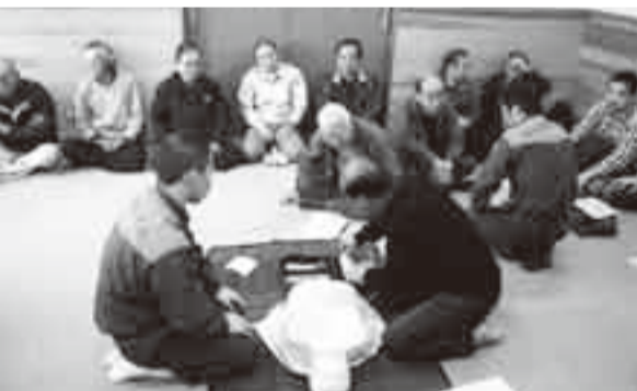
▲毎年自主訓練を行っている水郷町自主防災組織（平成19年12月2日）