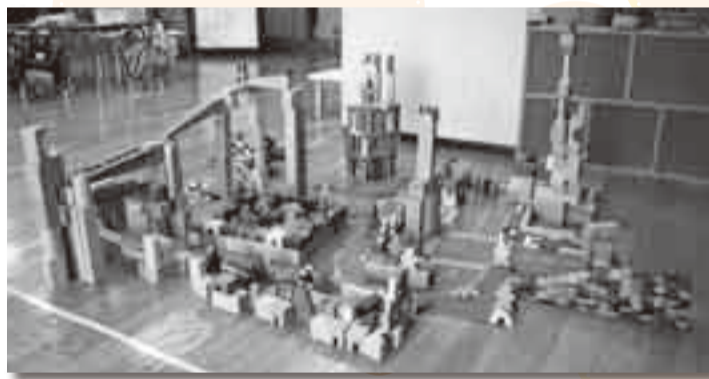
みんなで作ったディズニーランド

積木遊びが大好きなぼくたち、わたしたちです。ディズニーランド遠足から、ジェットコースターやシンデレラ城など、どんどん組み立てて作りました。