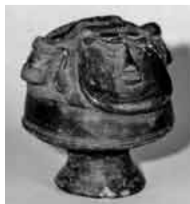
▲人面付香炉形土器