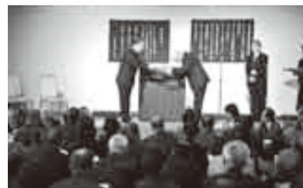
▲12月7日に行われた委嘱式

児童委員との連絡調整を行います。 問い合わせ 生活福祉課 健康福祉課 ☎(75) 3 0 0 0 健康福祉課 ☎(78) 2 1 1 4 健康福祉課 ☎(82) 1 1 1 5 健康福祉課 ☎(50) 1 2 0 9