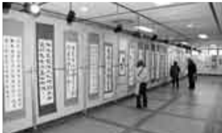
▲多くの書が展示された交流書道展

香取市文化協会連合会第1回交流発表会が12月20日から23日まで開催されました。佐原中央公民館では交流書道展が行われ、各区の書道部による書が展示されました。23日には佐原文化会館で、交流芸能発表会が行われ、ダンスや舞踊、独唱、箏曲など、各区を代表する演目に観客は魅了されました。 同連合会の柏崎会長は「今後このような交流会を開催し親睦を深めたい」と話していました。