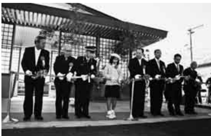
▲完成を記念して行われたテープカット

香取市には、楽しいイベントや出来事が盛りだくさん。 ここでは、そんなホットなまちの話題をご紹介します。