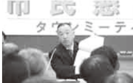
▲市民からの意見に回答する宇井市長

● 市民活動・生活など ・市民のボランティア活動、体制関係 ・花を植えるボランティア活動関係 ・市民バスの利用 ・市民懇談会配布資料関係 ・目的税(都市計画税)関係 ・旧市町初代市町長の墓への墓参り実施 問い合わせ 広報広聴課 (50)1204