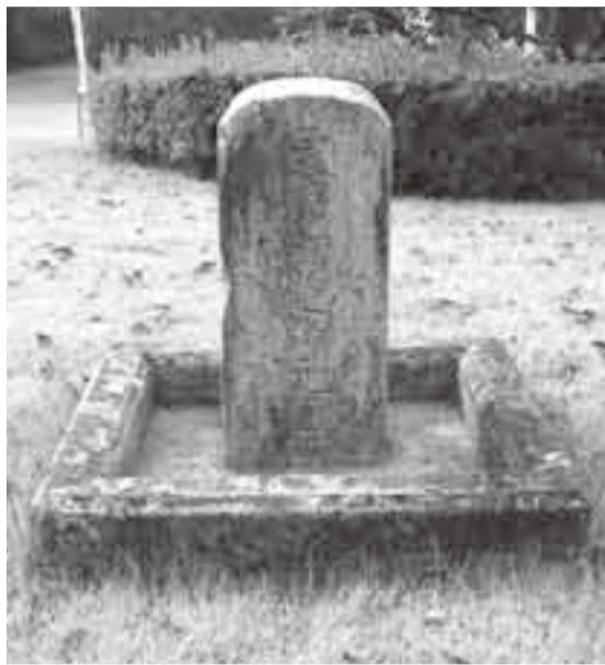
▲栗源区事務所敷地内に移設された道路元標

日本の道路の起点が東京日本橋にあることは知られていますが、これとつながるように、かつて全国の市町村に道路元標という石柱が設置されてきました。道路元標とは、大正8年(1919)に制定された