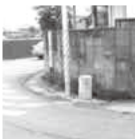
▲交差点に建つ道路元標 (八都)

園内にあります。栗源村のものは、元々国道沿いの旧役場入口付近にあったようですが、昭和61年の新庁舎(現栗源区事務所)建設後、平成元年に敷地内に移されました。 神社の前に設置されたものもあります。香取町では、香取神宮の旧参道から境内地に入る石段脇にあります。また東大戸村も元々の設置場所は大戸神社付近であったようですが、現在では国道沿い大戸駅入口信号脇に移されています。 形状・様式も定められています。大正11年内務省令には「道路元標には石材その他の耐久性材料を使用すべし」、また「道路元標は別記様式に依るべし」とあり、簡易な図が付されています。この図によれば、高さ60cm、縦横25cm角の石柱で、頭頂部にやや丸みを持たせ、正面には「何々市町村道路元標」と記すよう規定されています。市内に残るものはこの図とほぼ同じ規格で、石材は御影石が使われています。 石造物としての道路元標は画一的なものであり、設置者や年代なども刻まれていないため、あまり面白くない。 ※設置場所は交通量の多い場所なので、確認する場合は充分注意してください。