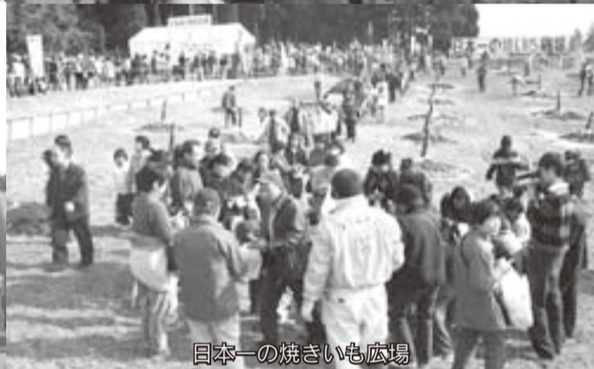
日本一の焼きいも広場