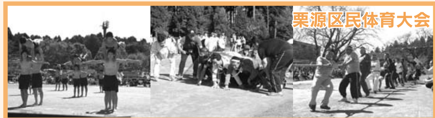
栗源区民体育大会

まちかど通信 香取市には、楽しいイベントや出来事が盛りだくさん。 ここでは、そんなホットなまちの話題をご紹介します。