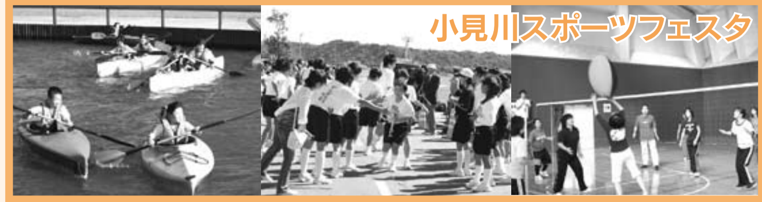
小見川スポーツフェスタ

体育の日を前に10月8日、各区でスポーツ大会が開かれました。台風の影響でときおり突風の吹く天候の中、多くの参加者がスポーツの秋を満喫しました。