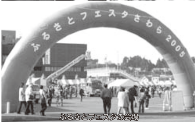
ふるさとフェスタの会場