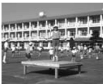
▲業間活動を利用しての全校縄跳び「持久跳びに挑戦」

私が通っている竟成小学校には、毎年、市の陸上大会が行われる大きなグラウンドがあります。きつと香取市の中で一番大きなグラウンドだと思います。そのグラウンドや体育館を使って、陸上、ソフト、ミニバス、駅伝を頑張っているととてもスポーツの盛んな学校です。毎年、どの大会でも素晴らしい成績が残せ、とてもうれしいです。竟成小では『みんな仲良く』を目標に1年生から6年生までの縦割りグループをつくり活動しています。竟成っ子グループと呼んでいます。竟成っ子グループは、業間活動、運動会や歩行会など、いろいろな場面で活動しています。全校のみんながこの竟成っ子グループでの活動により、とても仲良くなりました。また、みんなが仲良くなるためのたくさんの楽しい集会があります。今、一番楽しみにしているのは『さつまいも集会』です。5月に学校の畑に植えたさつまいもをみんなで収穫し、焼き芋にして食べます。今年はお芋に合った飲み物づくりもします。クイズやお芋コンテストも楽しいです。私たち児童だけではなく、お父さんやお母さん、おじいさんやおばあさん、地域の方々も参加できるので楽しみです。このように、私たちの学校では他の学年や地域の方々との交流を大切にしてみんなが仲良く活動しています。これからもみんなが楽しく通えるすばらしい学校にしていきたいと思っています。