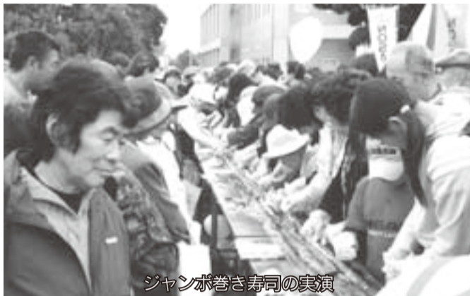
ジャンボ巻き寿司の実演