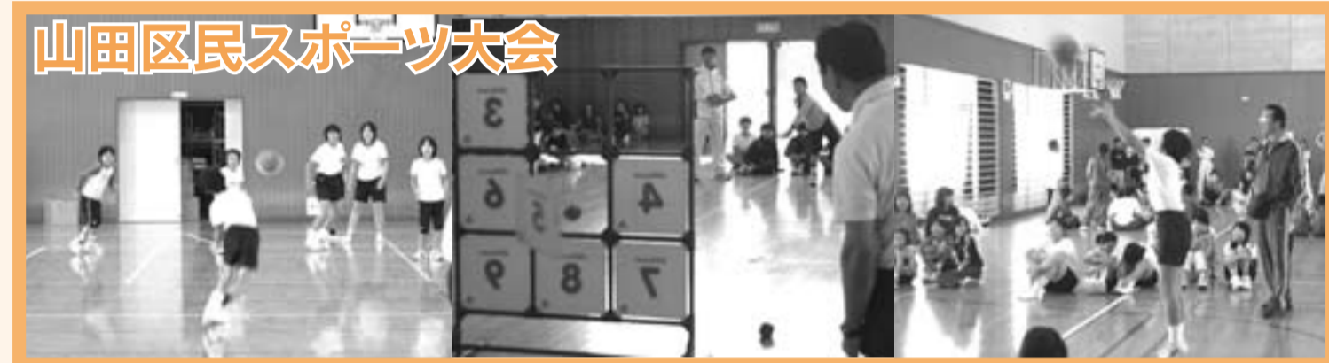
山田区民スポーツ大会