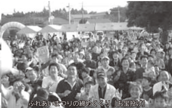
ふれあいまつりの締めくくり「お宝投げ」