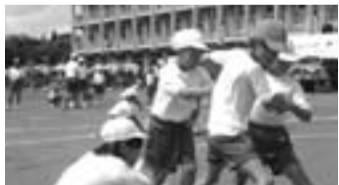
▲運動会で竟成っ子グループ対抗レース「ひよっこり竟成島」

少し開いている窓の間から、中学生が練習している下座、プラスチックの音、そして下校する生徒の賑やかな声が、爽やかな秋の風とともに、事務室に入ってきます。個人的に、一年の中で最も好きな季節です。さて、今月号にも掲載していますが、各区で軽スポーツ大会や運動会が開催されました。当日は、少し風が強かったですが、絶好のスポーツ日和でした。この季節、スポーツをするにしても、観戦するにしても最適ですね。なお、10月1日付で、市役所内で機構改革があり、広報担当課の名称が秘書広報課から広報広聴課になりました。一層の紙面の充実に努めますのでよろしくお願いたします。(W)