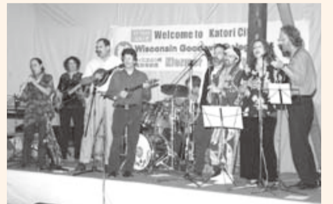
▲友好使節団のクレズマーバンドによる演奏

千葉県の姉妹都市であるウィスコンシン州の文化関係者とバ イオマス関係者などからなる総勢19人のウィスコンシン州友好使節団が、10月8日から8日間