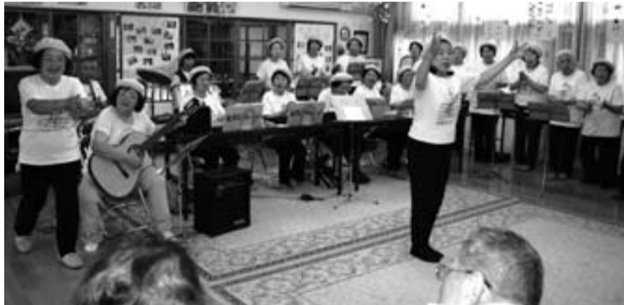
▲参加者と一緒に懐メロを合唱するあやめバンドの皆さん