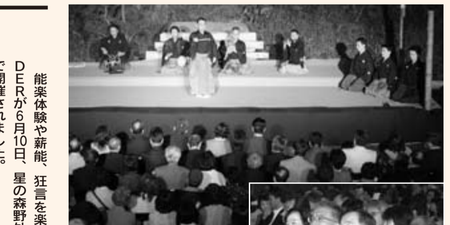
▲森に囲まれた舞台上で能を上演

「ほたるの里」では、7月17日(祝)にホタルの観賞会を開催します。詳しくは山田町商工会(☎78-2504)へ問い合わせください。