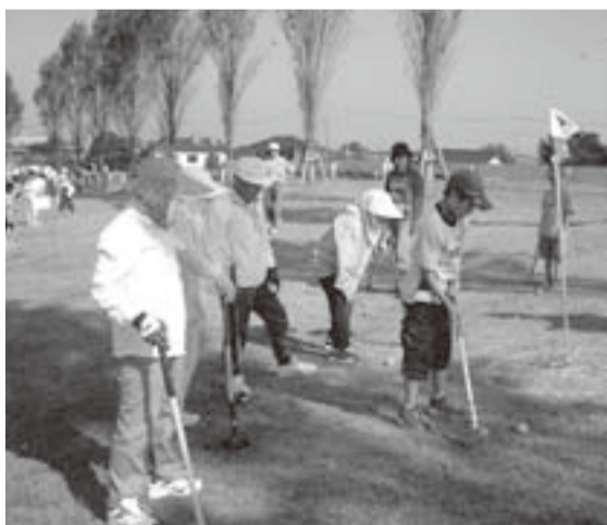
▲横利根門ふれあい公園で行われた『グラウンドゴルフ大会』。おじいさんやおばあさんは、とても上手でアドバイスしてくれます。