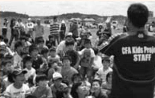
▲教室を前にインストラクターの話を聞く子どもたち

佐原河川敷自由広場のサッカー場で6月4日、市内の子どもたちを対象としたサッカー教室「キッズサッカーコミット」が開催されました。