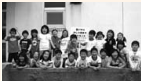
▲小見川東小学校の児童たち

「人権の花運動」感謝状贈呈式が6月2日に小見川東小学校、6日には北佐原小学校で行われ、千葉地方法務局長と千葉県人権擁護委員連合会長からの感謝状が贈られました。この運動は、子どもたちがお互いに協力しながら花を育てることにより、命の大切さや思いやりの心を育てることを主な目的としている運動です。