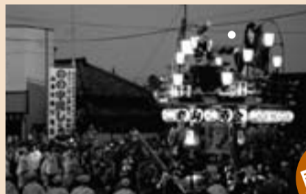
▲豪快なの字廻しを披露する山車(昨年の夏祭り)