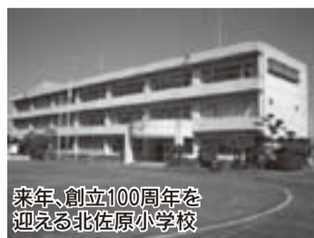
来年、創立100周年を迎える北佐原小学校

小学生がホタルの幼虫を放流するというので取材に行ってみました。場所は、水穴と呼ばれ、きれいな水が多くわき出る谷津田。子どもたちは、ちよつとグロテスクな幼虫を大切に放流していました。そういえばホタルを見たのはいつだったか? 私が小学校のころ(30年前くらい?)は、近所の田んぼでもホタルの光を見られたのですが、いつの間にか見られなくなりました。きれいな川であることを示す「水の指標生物」と言われるホタル。変わらない風景だと思っても川はだんだん汚れているのだと改めて実感しました。子どもたちが放流したホタルの幼虫は今月の半ばにはその元気な光を見ることができそうです。(K)