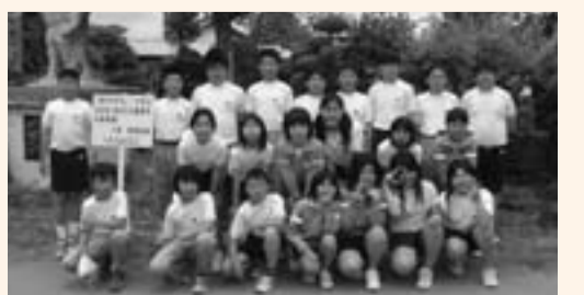
▲北佐原小学校の児童たち

平成17年度実施校の両校の児童たちは、それぞれ協力しながらシャクヤクを育てています。