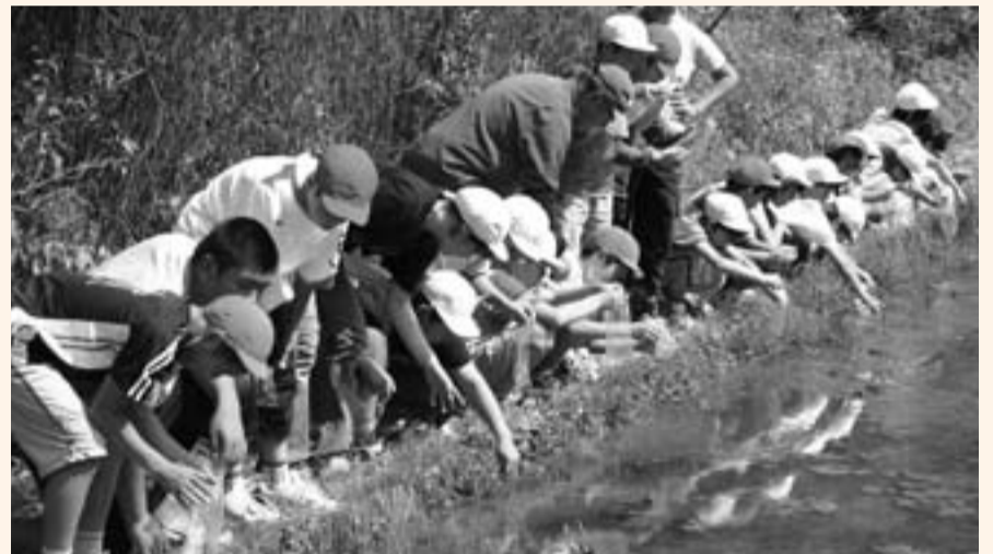
▲「大きく育って、しっかり光って」と願いながら放流する児童たち

第一山倉小学校の6年生23人が5月31日、新里の谷津田でヘイケボタルの幼虫1500匹を放流しました。