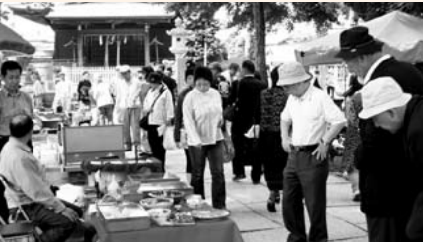
▲掘り出し物を見つけようと多くの人が品定めをする骨董市会場

八坂神社方向に人の流れを誘導し、この地区を活性化しようと6月4日、佐原本宿地区の守護神である八坂神社の境内で小江戸佐原の骨董市が行われました。