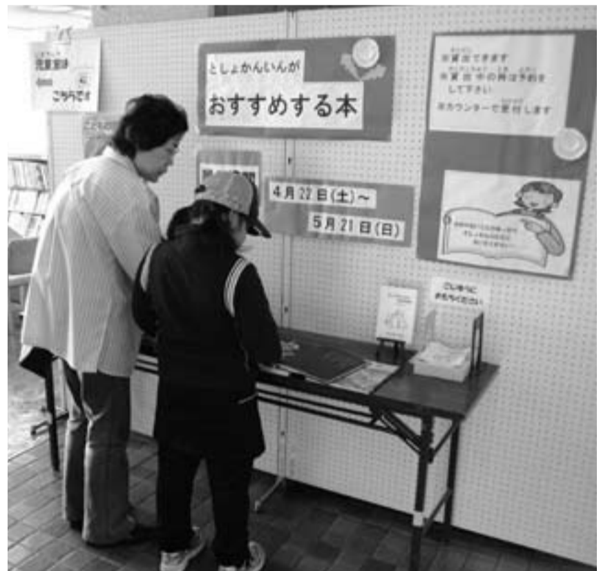
▲「次に何読もうかな」と悩む児童

お子さんは読書が好きですか。「本は大好き、今度は何を読もうかな」、「あんまり興味ないけど朝の読書時間に何読もう」と、どんな本を選べばいいか迷っていませんか。