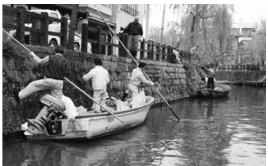
▲舟を使い護岸清掃する参加者

歴史的町並みの中心を流れる小野川の護岸清掃が、4月19日に「NPO法人小野川と町並みを考える会」を中心に、関係団体約20人が舟艇3隻を使用して行われました。足場の悪い舟艇からの作業は、慣れるまでに時間がかかりましたが、息のあった船頭役のさお使用で舟を安定させ、安全に行われました。小野川は護岸が高く雑草の除去などが困難なことから、関係団体が協力し舟艇を活用した清掃を行い、重要伝統的建造物群保存地区に選定されている町並みの景観の向上を図っています。