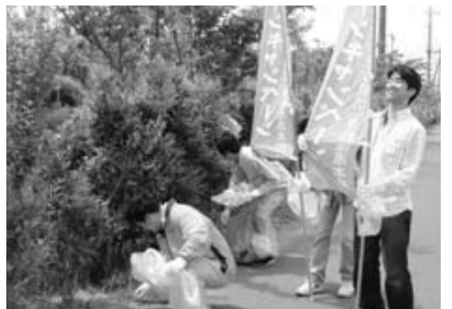
ゴミゼロ運動実施風景

問い合わせ ⑤ 環境安全課 ☎(50)1213 ④ 市民環境課 ☎(82)1123 ③ 市民環境課 ☎(78)2113 ② 市民環境課 ☎(75)2113