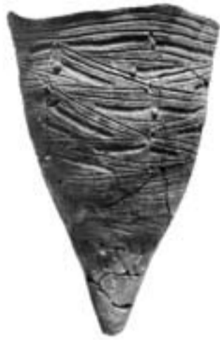
城ノ台貝塚出土土器

千葉県は世界的に見ても貝塚の集中が顕著な地域で、古くは明治時代から数多くの調査が実施されてきました。香取市を含む利根川下流域は、縄文時代のある時期、現在の大小河川域に海水が流入し、大規模な貝塚群が台地上に形成されまし