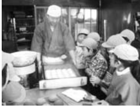
児童に和菓子づくりを指導する学校支援ボランティア

市教育委員会では、平成18年度から幼稚園や小中学校の教育活動を支援していただけるボランティアを募集しています。