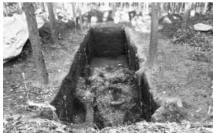
城ノ台貝塚発掘状況

城ノ台貝塚の調査では、シニホンジカシカ・イヌ・ニホンサルなどの獣骨、クロダイ・マダイ・スズキ・サメなどの魚骨、さらに骨で作った針・釣り針・ヤスなどが発掘されています。この香取地域の貝塚が物語るものは、後の奈良時代「香取の海」と呼ばれた広大な湖沼で活躍したであろう、また中世には「海夫」と呼称された漁民たちの原形となったのは、