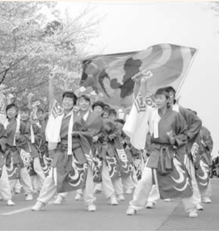
和よさこい会「和氣謠謠」の皆さん

桜の季節、各地で桜まつりが開催されました。 桜の名所として知られる城山公園で開催された、水郷おみがわ桜つつじまつり。さまざまなイベントが行われ、多くの人が春のひとときを満喫しました。 また、十間川や佐原公園、香取神宮でも桜まつりが開催され、満開に咲いた桜を楽しみました。