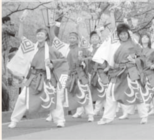
▲元気いっぱいの踊りを披露するおみがわ