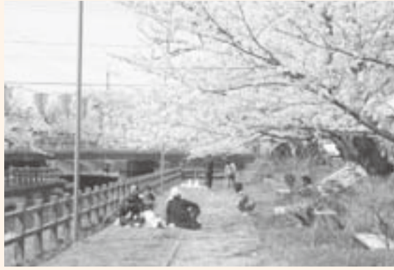
▲十間川を散歩がてらに花見