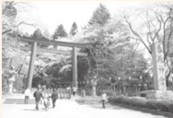
▲多くの参拝客が春の参道を満喫