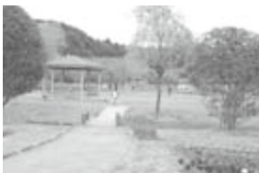
▲園内には安らぎのせせらぎ川や様々な花木が楽しめる四季花木園がある

「夏季には、約1000人がバーベキューやキャンプを楽しんでいますよ」というのは、広さ約6000㎡の出会いの広場。除草剤は一切使っていない芝生は、安心して手足を伸ばして寝ころべる。施設も野外テーブル、炊事場、かまど、トイレとバーベキューやキャンプをするには十分。利用するには事前に予約が必要だ。