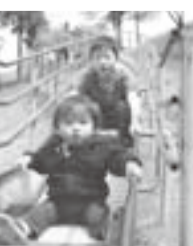
▲子どもたちに人気のローラーすべり台

「向こうの丘には、アスレチックがあるよ」と紹介されたのは、堰を見下ろす小高い丘の斜面に作られたアスレチックの森。アスレチック9施設に展望台、あずま屋、ベンチ、テーブルセット、遊歩道、トイレが併設されている。7月に