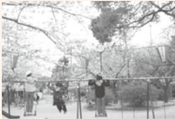
▲ブランコの上から花見(佐原公園)