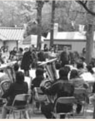
よるお花見コンサート

桜の季節、各地で桜まつりが開催されました。 桜の名所として知られる城山公園で開催された、水郷おみがわ桜つつじまつり。さまざまなイベントが行われ、多くの人が春のひとときを満喫しました。 また、十間川や佐原公園、香取神宮でも桜まつりが開催され、満開に咲いた桜を楽しみました。