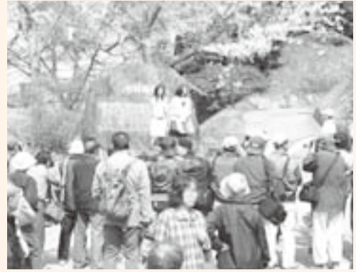
▲桜の下でのモデル撮影会