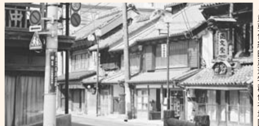
◀重要伝統的建造物群保存地区

旧佐原市は、平成6年に「佐原市歴史的景観条例」を制定。平成8年には、関東地方で初めて重要伝統的建造物群保存地区の選定を受けました。また、関東一といわれる山車祭りは「観光のまつり」としての体制づくりに取り組みました。このような町並み保存や祭りの開催などを通して、地元住民などで作るNPO法人や企業、行政が官民一体となった体制づくりなどが高く評価され、今回の受賞となりました。