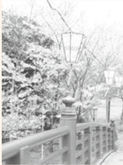
▲花見スポットの1つ「あかばし」