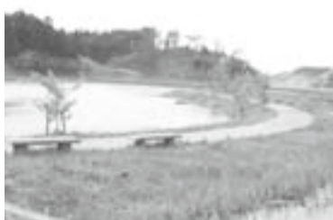
▲この季節ベンチに座ると水面を渡る風が心地いい

「歩道で散歩やジョギングに最適ですよ」というのは堰に沿った約7kmの歩道、散策の小道。野の草花と小動物たちを近くで観察でき、ほっと一息つくベンチも置かれている。