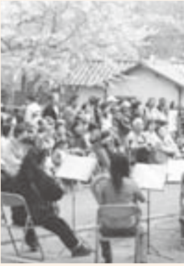
▲小見川吹奏楽団に