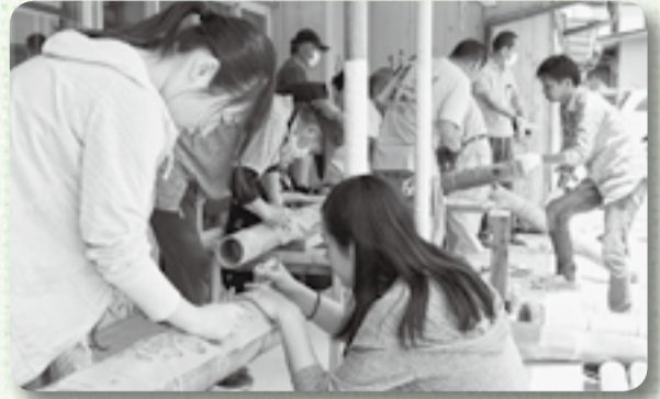
▲デザインもみんなで試行錯誤

8月に佐原おかみさん会が中心となり開催してきた「佐原・町並み・夕涼み」は、今夏から「佐原・町並み・竹灯り」に変わります。そこで、竹灯りを一緒に作ろうと呼びかけが