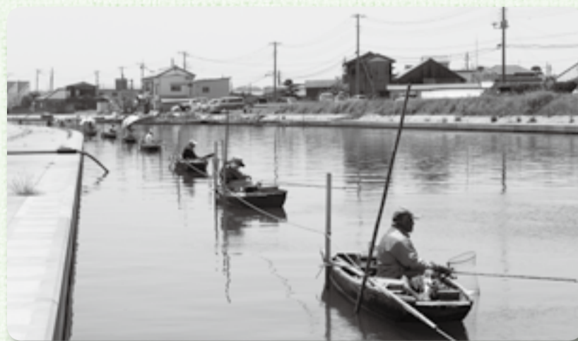
▲じっと魚信を待つ参加者たち

市の名釣り場である横利根川・長島川、黒部川を会場に5月8日と5月22日にふな釣り大会が開催され、市内外から大勢の腕自慢が参加し、釣果を競い合いました。