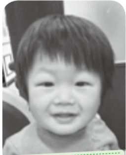
おいかけてこと お外遊びが大好き☆