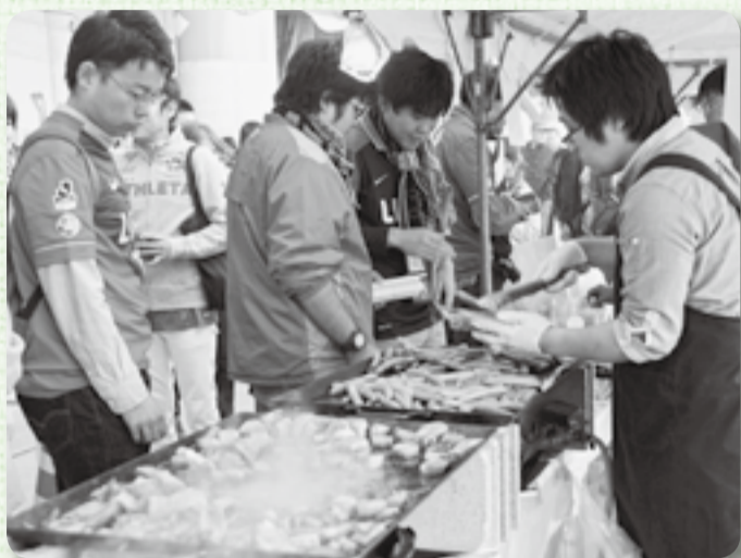
▲ハムやソーセージなどの匂いに誘われて長蛇の列が