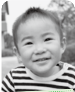
じいちゃんとお風呂に入るのが日課です。