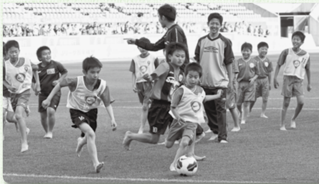
▲市内4チームが参加しました