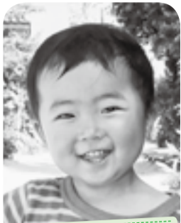
いつも笑顔で元気いっぱい☆ 我が家の太陽♡