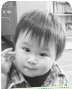
食べるのイストラだーいすき♡ 三男坊です♪