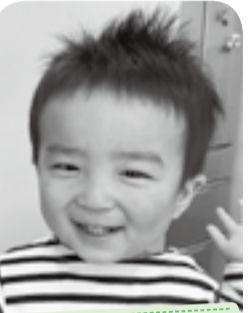
くるま・電車が大好き♪ かんだです！