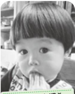
よく食べて、よく遊ぶ やんちゃっ子です！