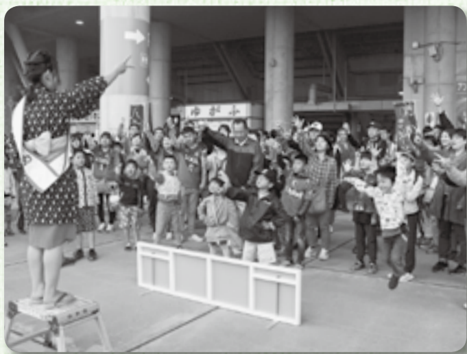
▲ジャンケン勝者には特産品をプレゼント