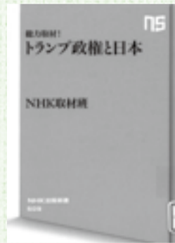
総力取材! トランプ政権と日本