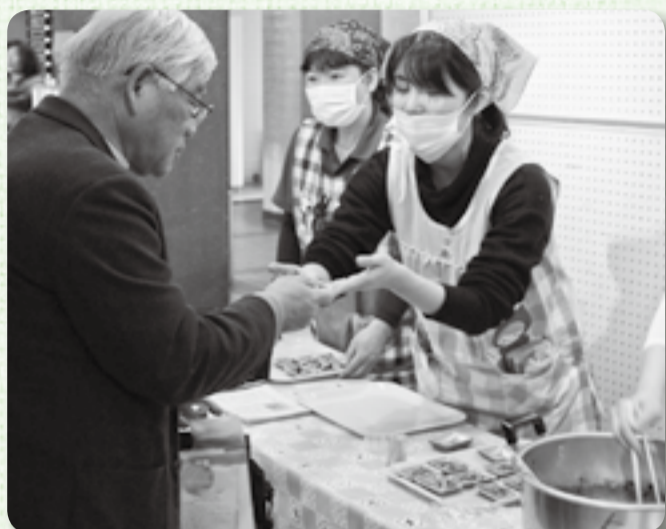
▲減塩メニューの試食