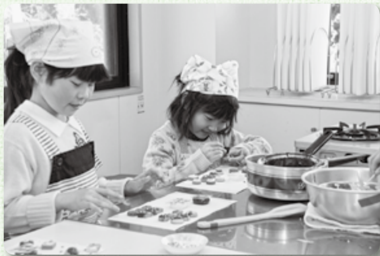
▲チョコペンで何を描こうかな？

バレンタインデー目の2月11日、山田児童館に集まった小学生24人がプレゼント用のチョコづくりに挑戦しました。市販のマシュマロやプレーンクッキーを、湯煎で溶かしたチョコレートでコーティングしたり、カラフルにデコレーションしたり、思い思いの飾りつけをして、かわいくラッピングしたら出来上がりです。