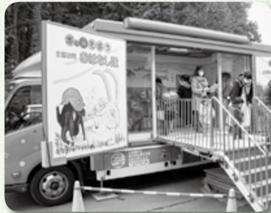
▲トレーラーの各所に絵本のキャラクターが

550冊の絵本を載せたトレーラーが、2月18日に山田児童館を訪れました。全国訪問おはなし隊は、2年間をかけて日本全国を巡ります。絵本がいっぱいの「移動図書館」に子どもたちは興味津々。気になる本を手にとって、お父さんやお母さんに読んでもらっていました。