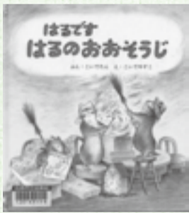
はるです はるのおおそうじ