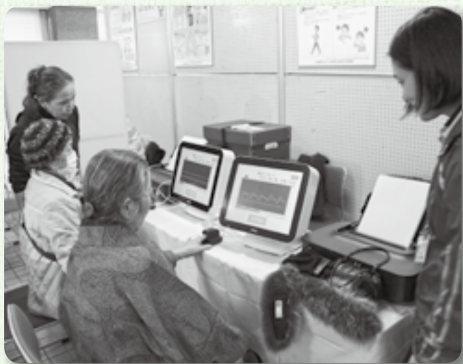
▲血管年齢など体の状態をチェック