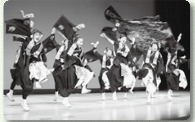
▲大トリは地元おみが和よさこい会「和氣譚話」が熱演

2月11日、小見川市民センター「いぶき館」で生涯学習フェスティバルが開催され、子どもからお年寄りまで大勢の来場者が「学習の祭典」を楽しみました。