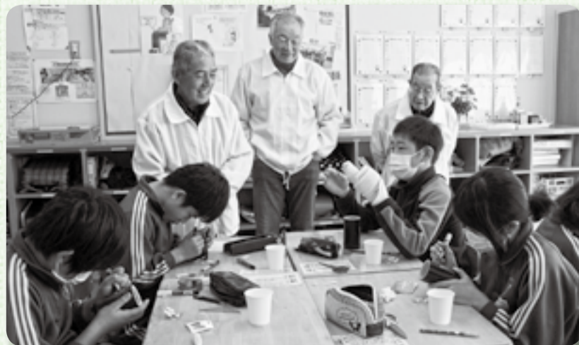
▲竹のように早い子どもたちの成長に目を細める

2月6日、小見川東小学校を卒業する6年生17人がおみがわ竹炭会の指導の下、卒業記念品として竹を使ったえんぴつ立てを作成しました。「大人になった時、机の上のえんぴつ立てを見て友達のことを思い出してほしい」という竹炭会の願いから始められたこの行事は、事前に校章の形が残るように焼いてもらった竹に、児童たちがカラフルな校章を個性豊かにデザインしていきます。中には、校歌や好きな歌の歌詞、クラスメイトの名前などを書く児童もいて、世界に一つだけのえんぴつ立てを完成させました。