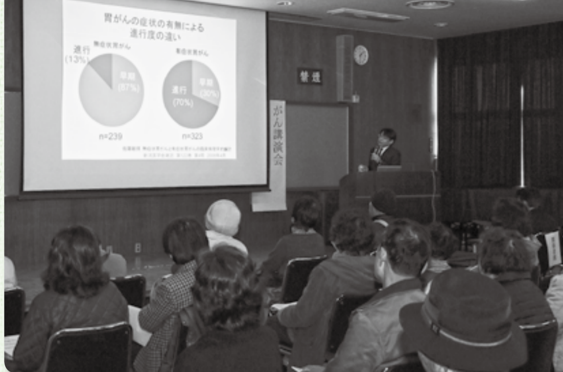
▲症状が出る前にがんを発見することの重要性を解説