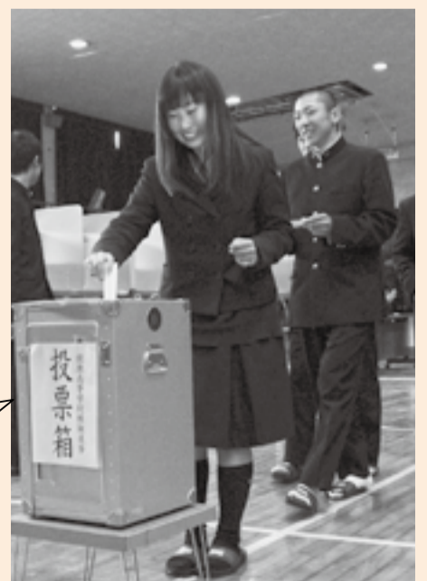
県立佐原高等学校での模擬投票(1月25日)

人たちに選挙や政治への関心を高めてもらうため、高校生に期日前投票立会人や投票事務を経験してもらっています。また、中学校・高校と連携して、模擬投票など出前授業の取り組みを始めています。