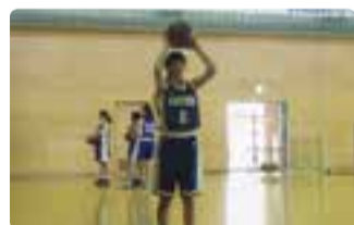
▲フリースローの練習中

月に数回、講師の先生にご指導していただきながら、自分たちのベストを尽くして勝つことを目標に、日々笑顔で練習に励んでいます。