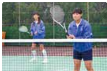
▲大会前の試合形式の練習

私たちソフトテニス部は、2年生5人、1年生5人の計10人で毎日楽しく活動しています。目標は「一球入魂」。最後まであきらめずにボールを追いかけるという意味がこめられています。また、県大会出場も大きな目標になっています。