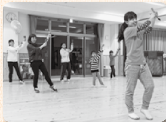
▲指導の声もテンポよく

夜の明照保育園に響く鳴子の音は、よさこい体験教室が開催されているためです。1月30日を含めて2回の教室で「どっこいしょ」と「スッゴイワールド」を習いたいと集まったのは11人。親子やご夫婦での参加もありました。おみが和よさこい会「和氣謠謡」の指導で初回に習った「どっこいしょ」は、全国どこでも踊られるポピュラーな曲。「運動会でも踊ったので興味があった」という小学生など、きちんと教わって踊れるようになりたかったという参加者だけに、終われば皆、充実感に満ちた表情。この成果は、2月の生涯学習フェスティバルで披露されました。