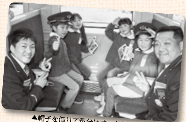
▲帽子を借りて気分はすっかり車掌さん