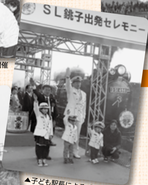
▲子ども駅長による「出発進行！」