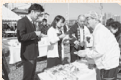
▲特産品開発事業発表会も開催