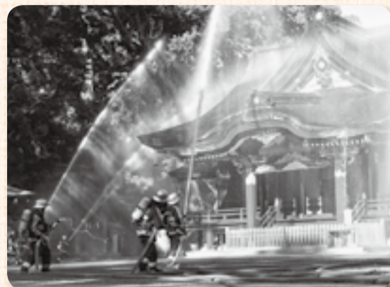
▲放水でできた大きな虹に歓声が

文化財防火デーは、昭和24年1月26日に、現存する世界最古の木造建築である奈良の法隆寺の金堂から出火し、壁画が焼損