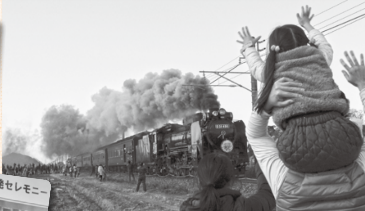
▲「お〜い!!!」お父さんの肩車で大きく手を振る女の子