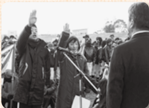
▲選手宣誓をする前年度駅伝優勝チーム代表

この日、地域交流を目的に行われた競技はミニマラソンと駅伝。「寒い、寒い」と言いながらも、始まってしまえば、元気いっぱい