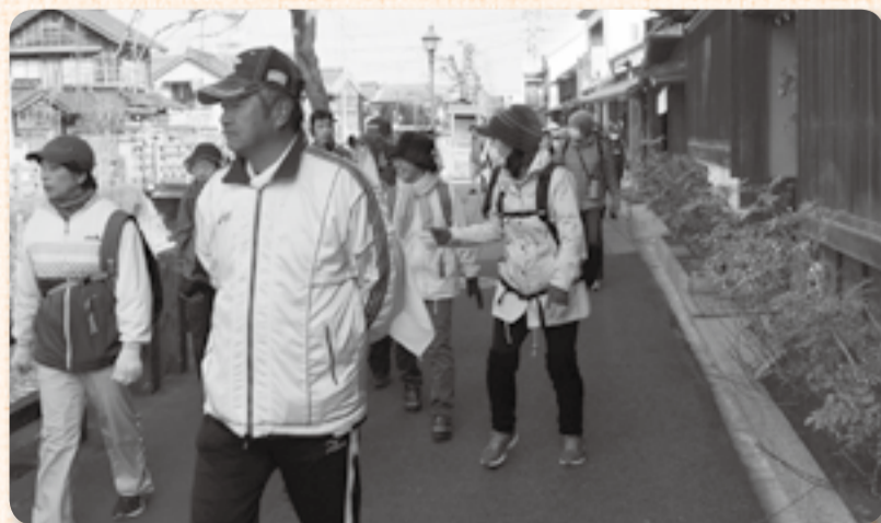
▲約14kmをのんびり歩く

じゃあじゃあ橋から水が落ちる音に癒されて再び歩き出した40人の参加者の列には「寒いけどよく晴れてよかったね」「歩くと気持ちがいいね」と笑顔が絶えず、参加者は爽やかな年始のウォーキングを堪能している様子でした。