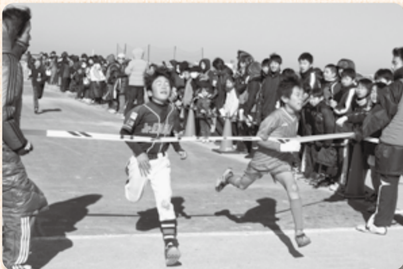
▲横並びでゴールに飛び込む白熱の一位争い

小雪が舞う1月24日、佐原河川敷緑地には香取郡市内のスポーツ少年団に所属する小学生約400人が集結しました。空は間もなく晴れるも、北風になびく団旗を先頭に整列する子どもたちは寒さで足踏み。見守る保護者や大会関係者も背中を丸めます。