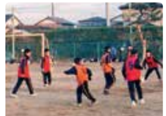
▲パス精度を上げるための練習

昨年12月に行われたU-13サッカー大会では優勝、1月に行われた天野杯では準優勝することができました。現在、7月に行われる総体に向けて練習に励んでいます。