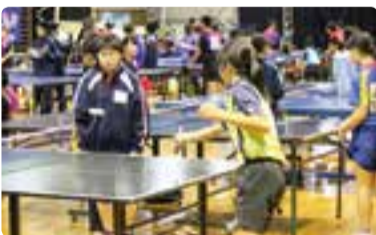
▲関東近県合同練習会の様子

私たち小見川中学校卓球部は2年男子6人女子5人、1年男子4人女子2人、合計17人で日々練習に励んでいます。