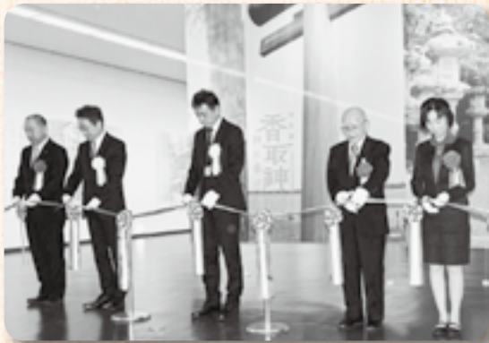
▲テープカットにより華やかにオープン