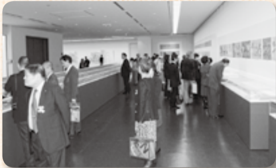
▲香取神宮神幸祭絵巻に見入る来館者