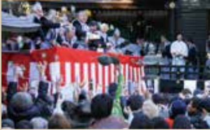
市内各所で節分祭