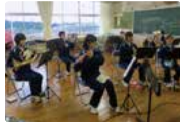
▲基礎練習を大切に

私たち、栗中ブラスバンド部は、1年生4人、2年生5人の9人で毎日楽しく活動しています。部員は少ないですが、音程や音量に気をつけ毎日練習を頑張っています。これからも一人一人が自分のパートに責任をもち、演奏していきたいと思っています。