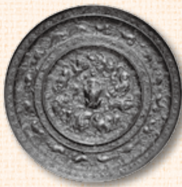
▲国宝の海獣葡萄鏡