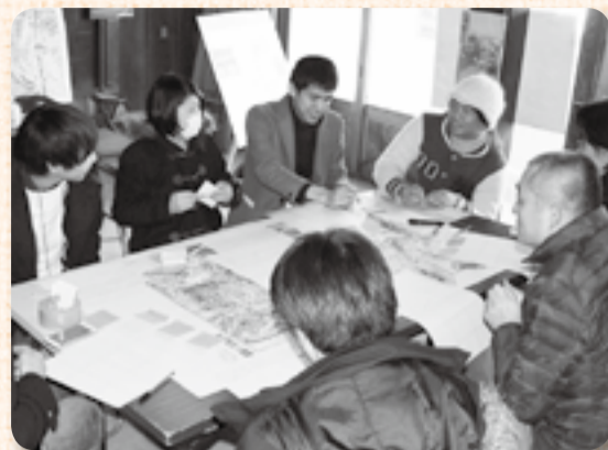
▲好きなどころと、嫌などころも併せて議論

東京大学の学生と佐原高校の生徒が中心となり、佐原のまちづくりを考える活動をしてきた「さわらぼ」。その活動拠点が新しくなり、12月20日に旧土屋刃物店でさわらぼ活用アイデアワークショップ