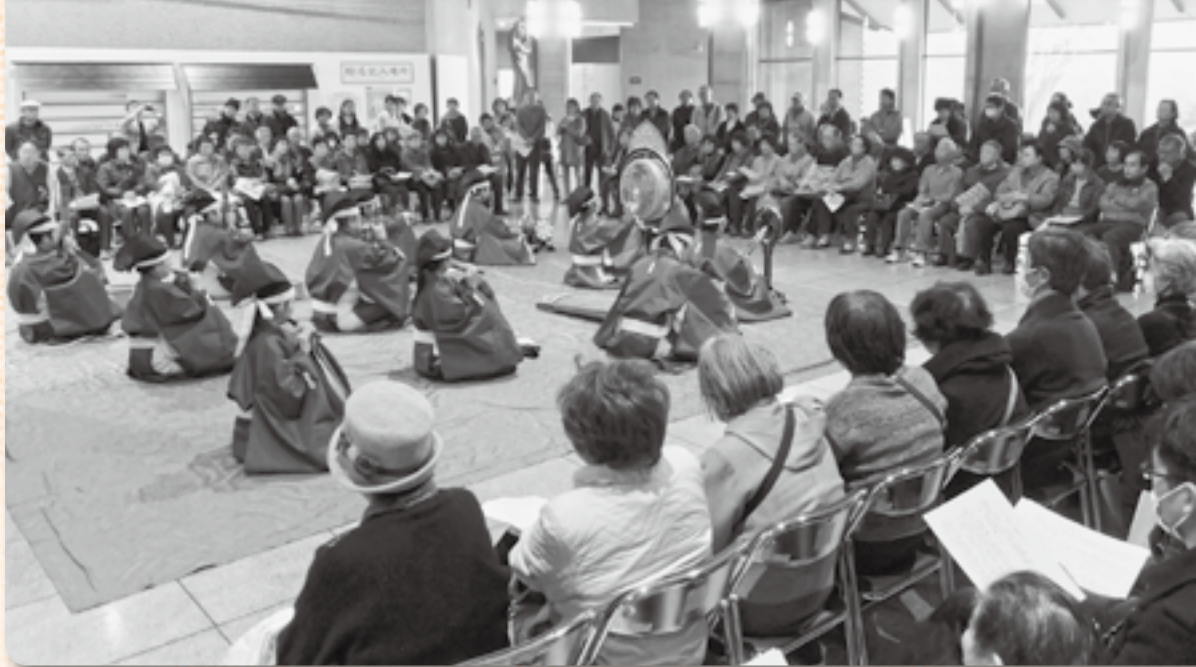
▲香取雅楽会による演奏