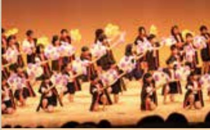
生涯学習フェスティバル