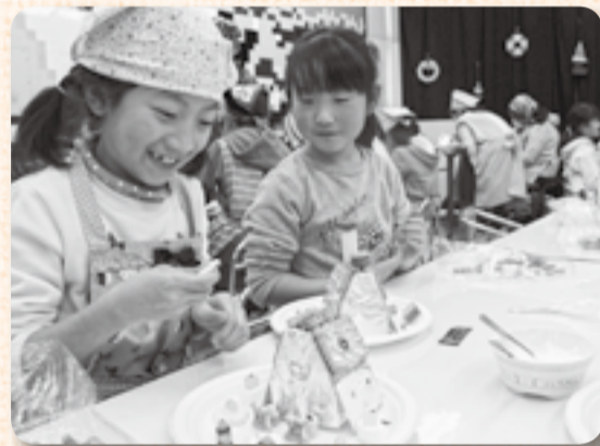
▲完成まであと少し

ビスケットや金平糖など、いつものおやつが屋根や庭の装飾に大変身するお菓子の家づくり。12月20日、山田児童館には小学生35人が集まり、小さなお皿の上にそれぞれの“世界”を表現しました。パンでできた小さな人形や「ピンセットがほしい」と言うくらい小さなチョコの飾りを丁寧に並べていたかと思うと、お口に運んでモグモグ…。それでも1時間かけて完成させ、ひとしきりゲームで遊んだあと、「みんなで食べたい」とお菓子の家を大事に持ち帰りました。