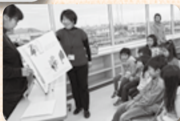
▲グリとグラのお話にくぎづけ