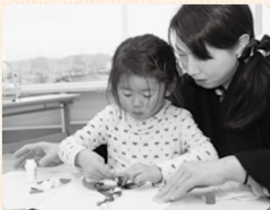
▲やっぱりリボンも付けなくちゃ

12月23日に小見川市民センター「いぶき館」で小見川図書館主催の絵本の読み聞かせとかんたん工作教室が開催されました。この日集まった20組の親子は、リースの型紙にリボンや折り紙、モールなどをボンボンで飾り、思い思いのリースを作成。「次はパパの分を作る!」と2つ目の作品づくりにも挑戦する参加者が続出。付き添ったお母さんたちからは、手助けをしながら「私も作りたくなっちゃった」という声も。最後にクリスマスにちなんだ大型絵本の読み聞かせに耳を傾け、一早いクリスマスを満喫していました。