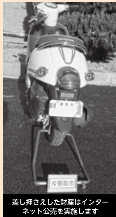
差し押さえした財産はインターネット公売を実施します

市では、税負担の公平性を確保するため、十分な資力があいながら納付しようとしないう滞納者に対して次の項目で差し押さえを行い、滞納している税金に充当しています。