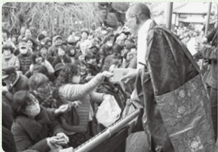
▲福豆を求め、熱気あふれる境内（観福寺）