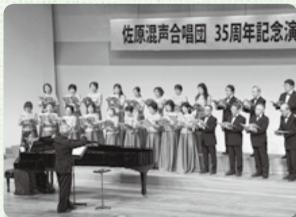
▲ピアノの伴奏が歌声をひき立てます

2月13日、佐原混声合唱団が35周年を記念し演奏会を開き、佐原文化会館に美しい歌声を響かせました。