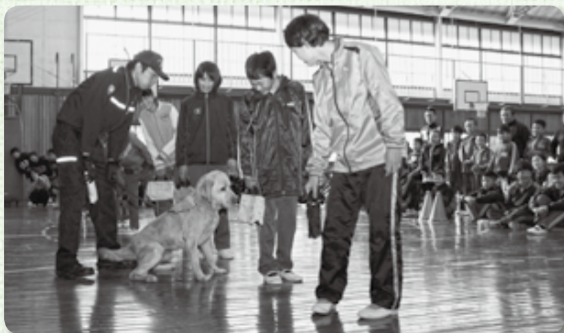
▲発見すると、座り込んで教える麻薬探知犬

神南小学校で2月8日に成田空港で勤務する税関職員を招いて、薬物乱用防止教室が行われました。参加した、5、6年生32人と保護者たちは、薬物の危険性の話のほか、税関の不正薬物の水際阻止や麻薬探知犬が薬物を検知する様子を体験しました。全校児童が参加して特に盛り上がった麻薬探知犬のデモンストレーションは、一列に並んだ子どもたちのバッグを麻薬探知犬が嗅ぎ分けて、麻薬のにおいがするバッグを当てるといったもの。子どもたちは身を乗り出して麻薬探知犬の行動を見守り、見事当てると会場から大きな拍手が起きました。