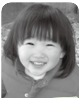
ニコニコ笑顔で、おしゃべりも上手になりました♡