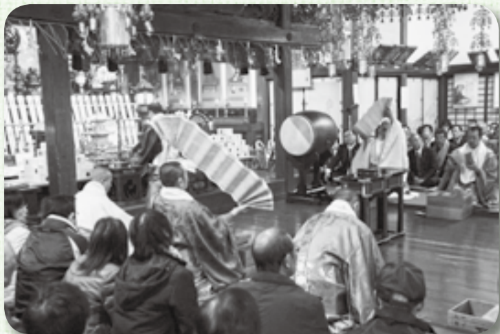
▲僧侶たちによる迫力の転読（観福寺）