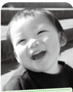
ダンスとお芋が大好きないたずらっ子です♪