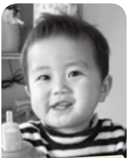
ねえね、にいに大好き♡とても活発な男の子!!