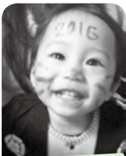
2016年も元気いっぱいにお過ごしな☆