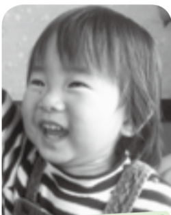
お祭り好きな子、手をあげて～!はあ～い♪