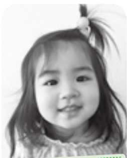
お姉ちゃん達だあーいすき★