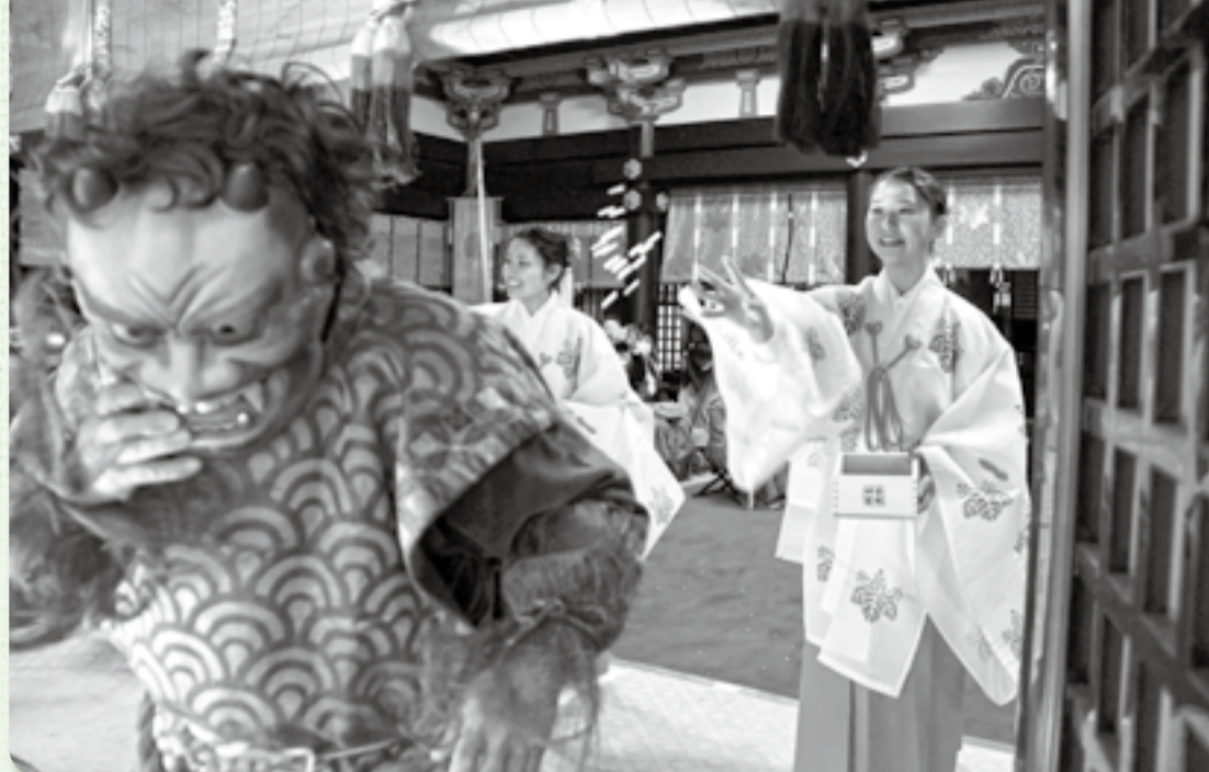
▲福娘の豆まきに鬼も退散（香取神宮）