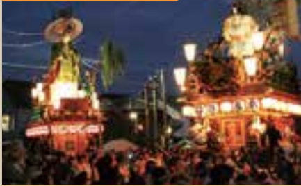
佐原の大祭 秋祭り