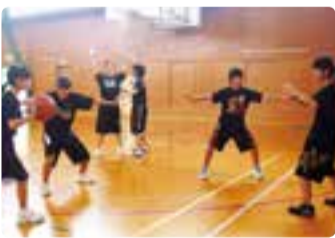
▲マンツーマンディフェンスを強化!

私たち女子バスケットボール部は、「チームワークを大切に!」をモットーに、毎日の練習に励んでいます。