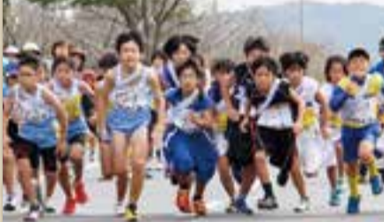
小見川スポーツフェスタ