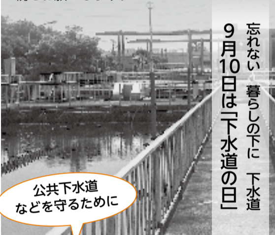
公共下水道などを守るために

公共下水道や農業集落排水処理区域内では、下水道管への接続が義務付けられていますので、処理区域内の皆さんは早急に接続をお願いします。