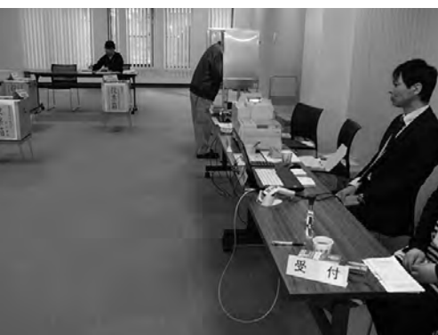
栗源支所に開設した期日前投票所

A 本庁・支所どの期日前投票所でも、投票できます。投票時間は、事務従事者、投票立会人の確保などを考えて検討します。