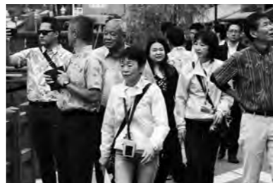
来日客と通訳ガイドの皆さん

A 佐原駅前観光案内所や町並み交流館では、案内表示や観光パンフレットを多言語対応にしています。水郷佐原山車会館のビデオシアターでは、多言語対応アプリ、おもてなしガイドを導入しています。現在は英語のみですが、拡充に努めます。