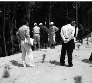
県と市で指導した再生土処分場

Q 住民自治協議会を発展させるために、機器の整備は市の負担でできないか。 A 耐用年数が経過した事務機器は、協議会補助金内で更新していただくことになりました。