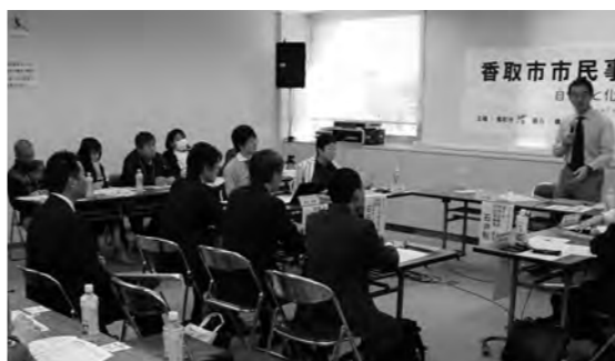
さまざまな意見が出された市民事業仕分け

Q 大幅な見直しの具体的な内容は。 A 整備費および維持管理費を縮減するため、規模や仕様を見直しています。