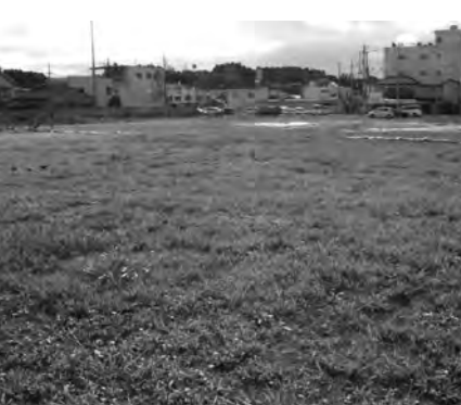
佐原駅周辺複合公共施設の建設予定地