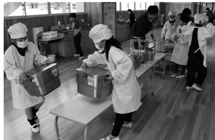
みんな楽しく準備する学校給食