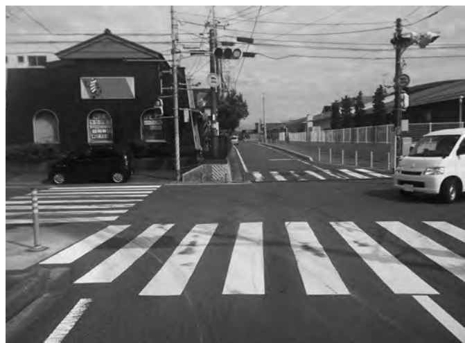
おみがわこども園に隣接する交差点

は別に利便性や安全性の向上を考えた場合、道路形状の見直し、こども園側の接続道路の拡幅など、検討課題があります。