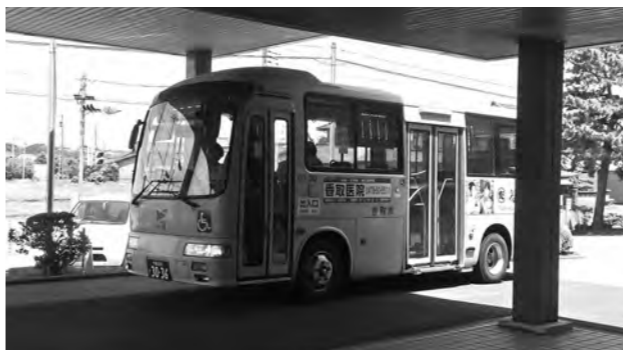
市民の大切な交通手段の循環バス

A 敷地所有者の同意を得る必要があります。また、駐車場を走行するため、歩行者の安全確保が重要で、設置の可否は慎重に検討する必要があります。