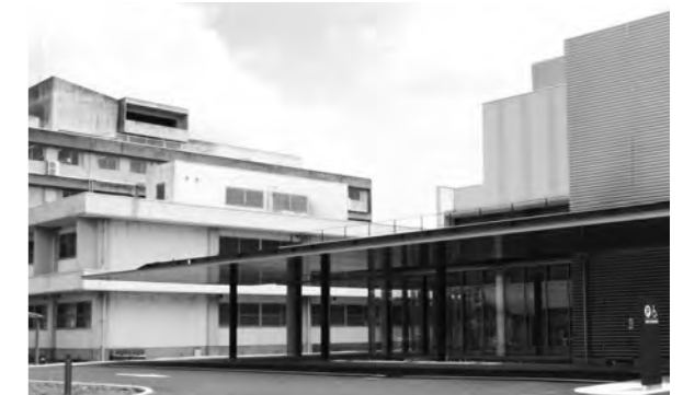
小見川総合病院(奥)と香取おみがわ医療センター(手前)

A 平成30年1月1日時点の固定資産評価額で全体の86%を香取市、14%を東庄町の持ち分として決定し清算します。