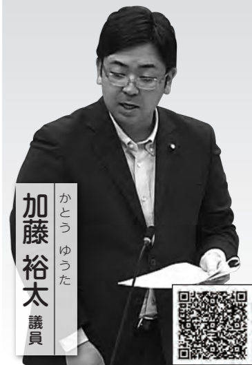
かとう ゆうた 加藤 裕太 議員

Q 市の魅力の世界中の人に知ってもらう機会が増えている。近年の観光客数は、東日本大震災時には約636万人まで落ち込みましたが、最近では700万人程度まで回復しています。