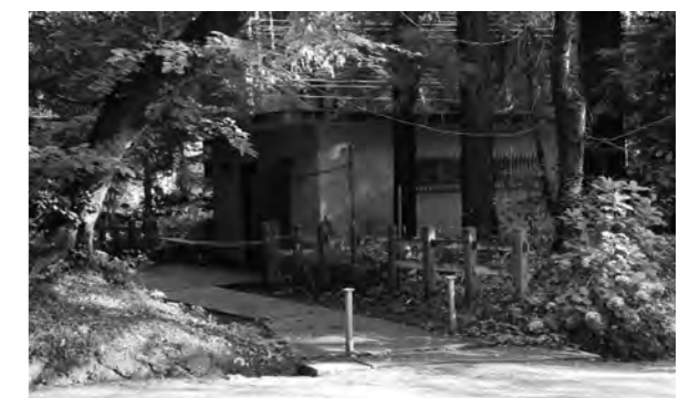
解体する香取神宮境内の公衆便所

A この条例で規定する公衆便所は12施設あります。平成30年度の決算見込み額で1,013万5千円です。