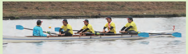
議員クルーは2チームに倍増しました