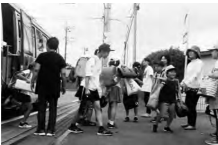
多くの人が見守るスクールバス