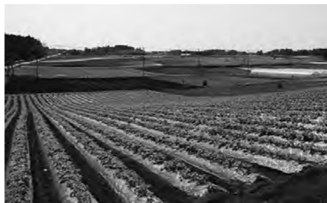
さまざまな野菜が栽培される畑作地帯