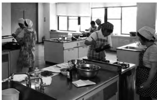
調理する配食ボランティアの皆さん

A 30年以上実践された地区社協をはじめ、ボランティアの皆さんに、敬意を表し深く感謝します。介護保険制度の改正とともに、食の自立の観点から十分な評価や査定をした上で、計画的、有機的につなげて提供されることが求められています。