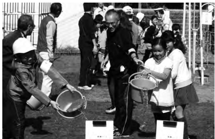
幅広い年代の皆さんが参加した防災訓練

Q 家庭用火災報知器の設置状況と普及促進のための対応は。 A 消防本部によると平成30年6月現在、設置率は55%です。市では総合防災