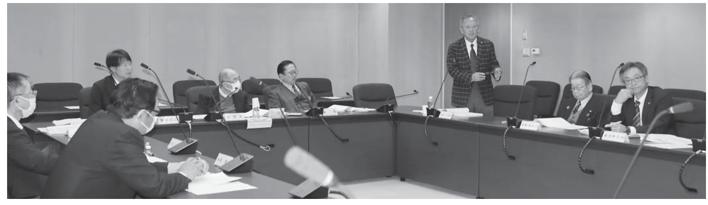
福祉教育常任委員会

Q 火入れの定義は。また、条例改正後も消火器具の配置は担保されるか。 A 森林または森林の周囲1kmの範囲内にある土地で、立木竹、草、堆積物等を面的に焼却する行為が火入れの定義となります。また、消火器具の配置は、のこぎり、かま、なた、スコップ、バケツ等の消火に必要な器具を火入従事者に携行させなければならないと規定しており、引き続き担保されます。