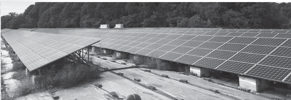
伊地山太陽光発電所

A 事業収入の増額 は今年度、伊地 山及び大戸太陽光発電 所の太陽光パネルを洗 浄したこと等による発 電量の増加を見込んで います。また、伊地山・ 大戸・大戸・附洲新田は 設置から10年が経過し ていることから、発電 設備の定期メンテナン ス及び細密点検を太陽 光発電施設維持管理基 金から繰入れて実施し ます。