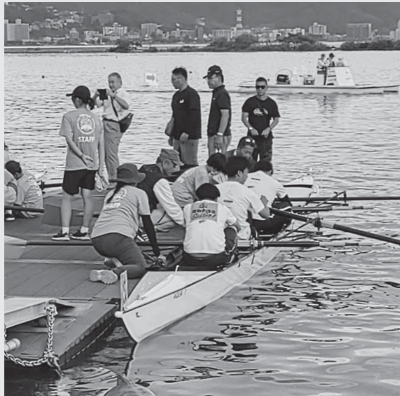
多くのボランティアに支えられた全国市町村交流レガッタ

9月30日から10月1日まで、第32回全国市町村交流レガッタが、長野県下諏訪町の諏訪湖畔にある下諏訪ローイングパークで開催されました。議員の部へ参加した市議会のクルーは、市民レガッタのTシャツを身にまとい、果敢に挑戦しましたが、惜しくも予選突破とはなりません。その後は、ともに出場した市民クルーの応援に精一杯声をからした結果、男子160歳未満の部の「KATORI F.D.」が見事に第3位、女子160歳以上の部の「FRESH COOL 美z」が第5位の成績を収めました。参加クルーは雄大な諏訪湖畔で、全国から集まった皆さんと水上スポーツによる交流を深めました。