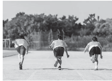
子どもたちのためによりよい部活動の地域移行を

プレーの練習の機会が増えるなど技術の向上につながると思われられます。また、受け皿となるクラブの指導者は競技に精通された人となり、他校の選手との交流も含め競技力向上にもつながるものと思われています。