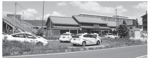
佐原駅前のタクシースタンド

Q 公共交通施策推進事業について、その概要は。 A 市内に路線を有する高速バス事業者に対し、1便につき5万円、路線バス事業者に対しては一路線当たり30万円、また市内に事業所を有するタクシー事業者には、1事業所当たり一律10万円と登録車両1台につき3万円を上限30万円まで支給します。