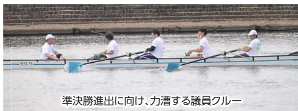
準決勝進出に向け、力漕する議員クルー

7月2日に黒部川特設コースで「第18回香取市民レガッタ」が開催されました。議員クルーは、惜しくも予選敗退となりましたが、水上スポーツ普及活動の一助となることを願い、力を合わせ漕ぎ進めました。