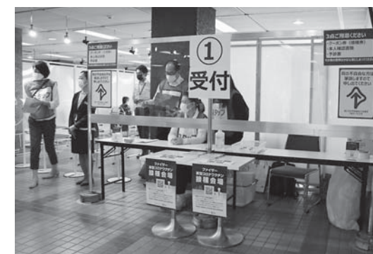
新型コロナウイルスワクチン集団接種受付の様子(佐原中央公民館)

A 新型コロナウイルスワクチン接種に関する相談や集団接種の予約を行うコロナワクチンコールセンターを開設していますが、問い合わせなどの増加が予想されることから受付体制を強化するものです。