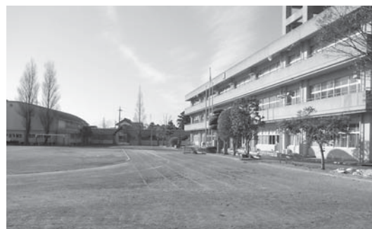
統合校舎となる現津宮小学校

令和4年4月1日に津宮小学校と大倉小学校を統合し、新たに「水の郷小学校」として開校します。