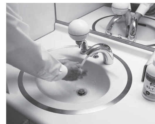
コロナ対策としてトイレ洗面用水栓の自動化を図る

A 現在、自動化していないトイレの洗面用水栓は、本庁舎で18カ所、小見川市民センターで24カ所あり、新型コロナウイルス感染症対策として、これを自動化するものです。