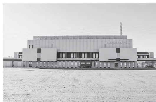
地方独立行政法人への移行を進める香取おみがわ医療センター

A 理事会は、病院を運営していく役員会となり、評価委員会は、市の附属機関となり、病院の理事会で決定した病院経営の内容を評価していきます。