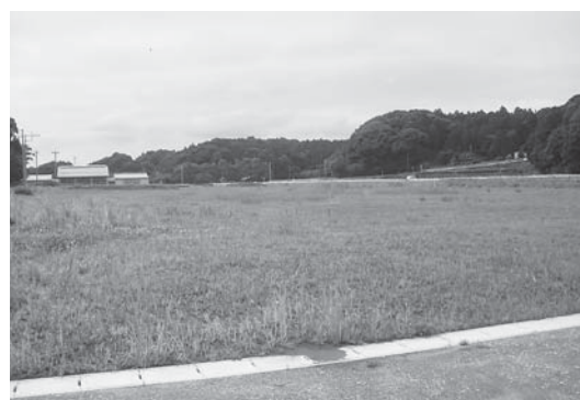
整備を進める橘ふれあい公園(パークゴルフ場建設予定地)

A パークゴルフ場は運営独立採算制のため、経費を抑え、且つきれいに維持管理ができるものが提案されと考えます。