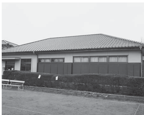
本宿コミュニティホーム

A 令和元年度に香取市個別施設計画が策定され、この中で本宿コミュニティホームは、昭和54年度の建築で老朽化が著しく、費用対効果から大規模改修も難しい状況で、用途廃止する方向とされ、令和2年度から利用団体に対する説明と、代替施設等の活用の協議を進めてきました。地域への譲渡も含めて協議を重ねましたが、施設が老朽化しているため、譲り受けしてくれる団体がなく、代替施設の選択肢として考えられるコンパスが令和4年にオープンしたことなどから、指定管理者による管理を令和5年度まで3年間延長し、指定管理期間終了後は施設を廃止することで、全ての利用団体に同意をいただき進めてきました。