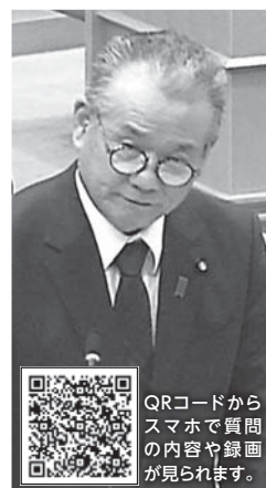
QRコードから スマホで質問 の内容や録画 が見られます。