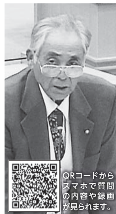
QRコードから スマホで質問 の内容や録画 が見られます。