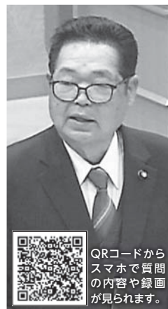
QRコードから スマホで質問 の内容や録画 が見られます。