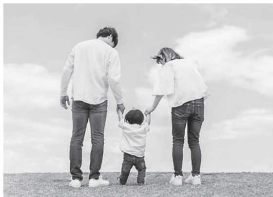
育児中の家族の様子