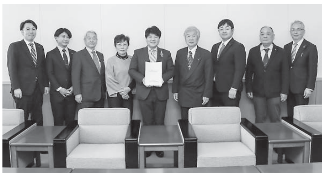
市長に公共交通に関する報告書を提出した 総務政策常任委員会委員の皆さん