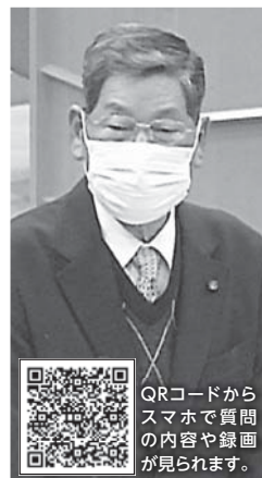
QRコードからスマホで質問の内容や録画が見られます。

Q 今後、完全無償化の実施予定は。 A 実施には大きな財政的負担が伴うことから、今後も引き続き国や県等の動向を注視しつつ、安定した財源の確保に努め、完全無償化を目指します。