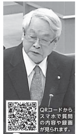
QRコードから スマホで質問 の内容や録画 が見られます。

A 指定避難所の体育館の暖房設備は、主に石油ストーブを使用し燃料も保管していますが、避難期間によっては、その量が十分でない場合も想定されます。そのため、災害時に優先的な燃料の供給が受けられるよう、千葉県石油商業組合等と災害協定を締結しています。ベッドは、フレーム部分がスチール製で、シート部分がポリエステル製の折り畳み式簡易ベッドを1500台備蓄しており、展開時の高さは、床上43cm程度です。