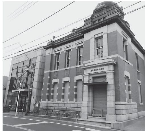
佐原町並み交流館および佐原三菱館