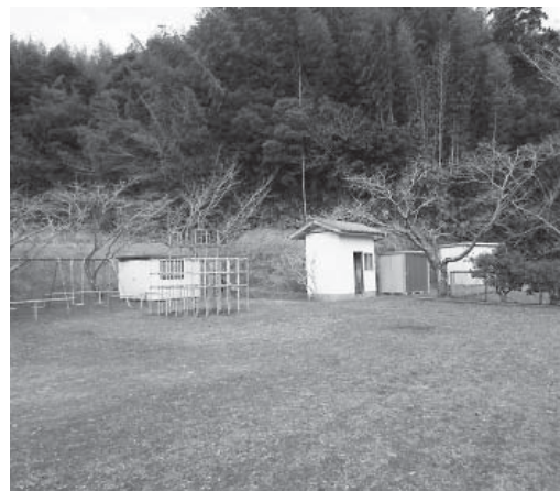
廃園となる丁子児童遊園