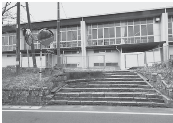
石段となっている佐原小学校体育館側面出入口

A 主な事業内容は、佐原小学校体育館敷地の側面出入口は石段となっており、安全確保のため、この石段を撤去しスロープを設置します。