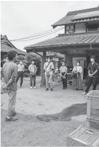
農家ツアーの様子