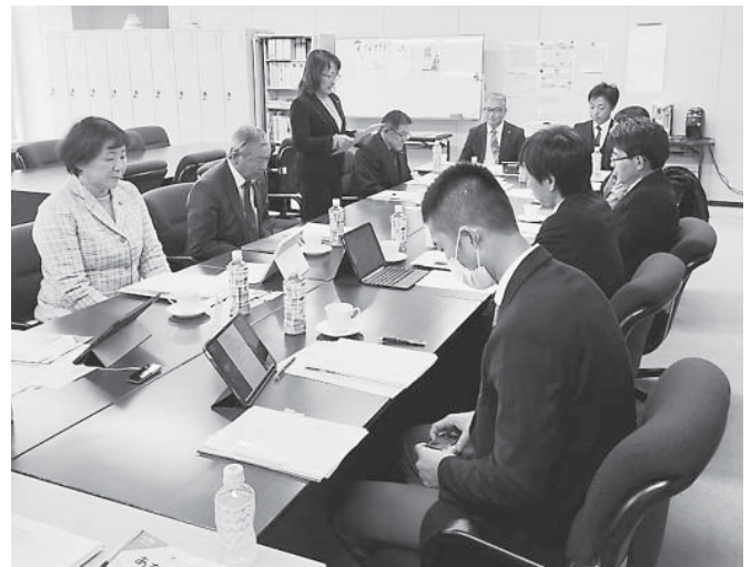
議会広報紙の編集について説明を受けた富里市議会議員の皆さん

個性あふれる地域力を生かしたまちづくりや特色ある施策等の紹介をはじめ、市内宿泊施設や商店等を利用いただき、全国へ市の魅力を発信する活動を行っています。令和5年度に受け入れを行った行政視察について紹介します。