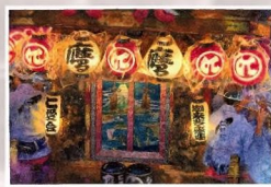
アニメトイ (AnimaToey) イラストレーター/水彩画家