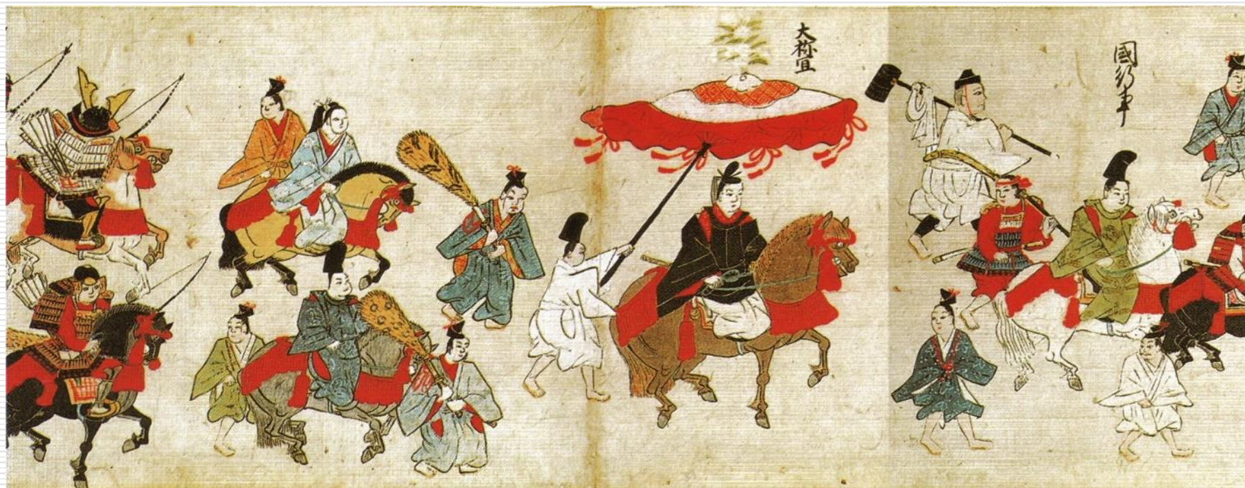
香取神宮神幸祭繪卷(権檢非違使家本)(『千葉県史研究第15号』H19.3)