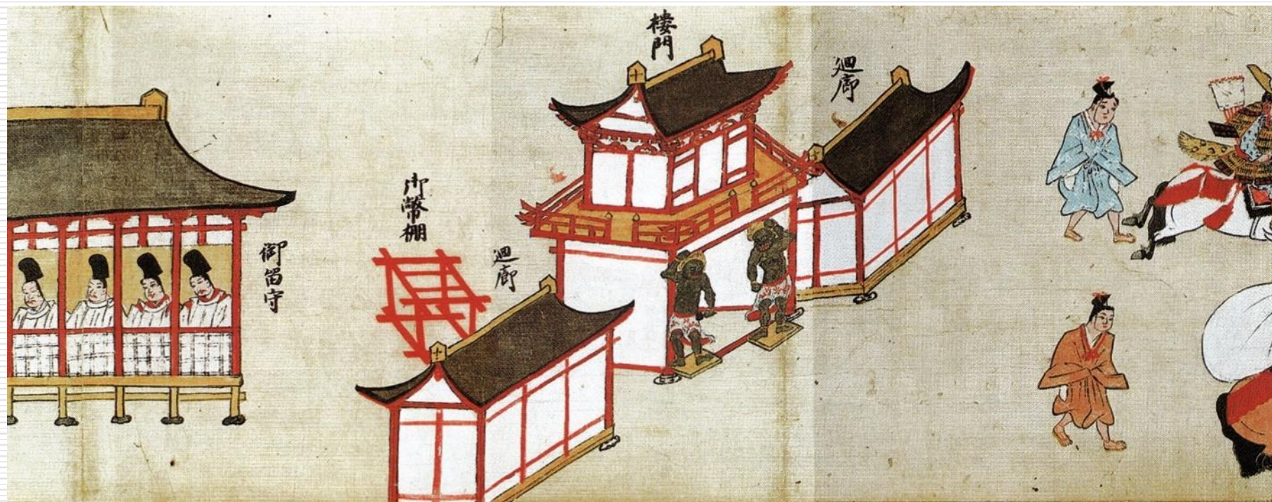
香取神宮神幸祭繪卷(権檢非違使家本)(『千葉県史研究第15号』H19.3)