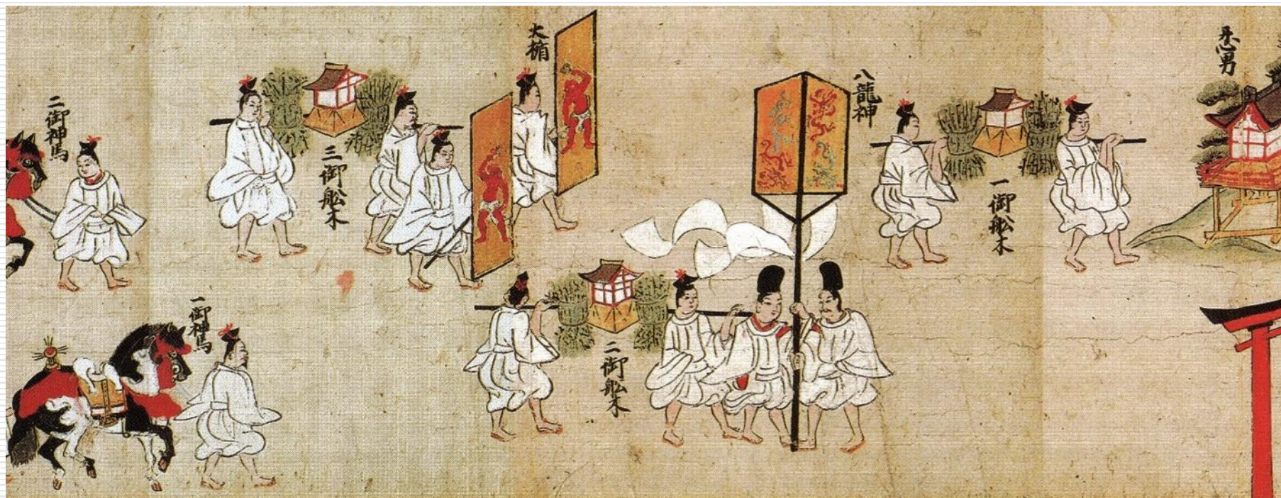
香取神宮神幸祭繪卷(権檢非違使家本) (『千葉県史研究第15号』H19.3)