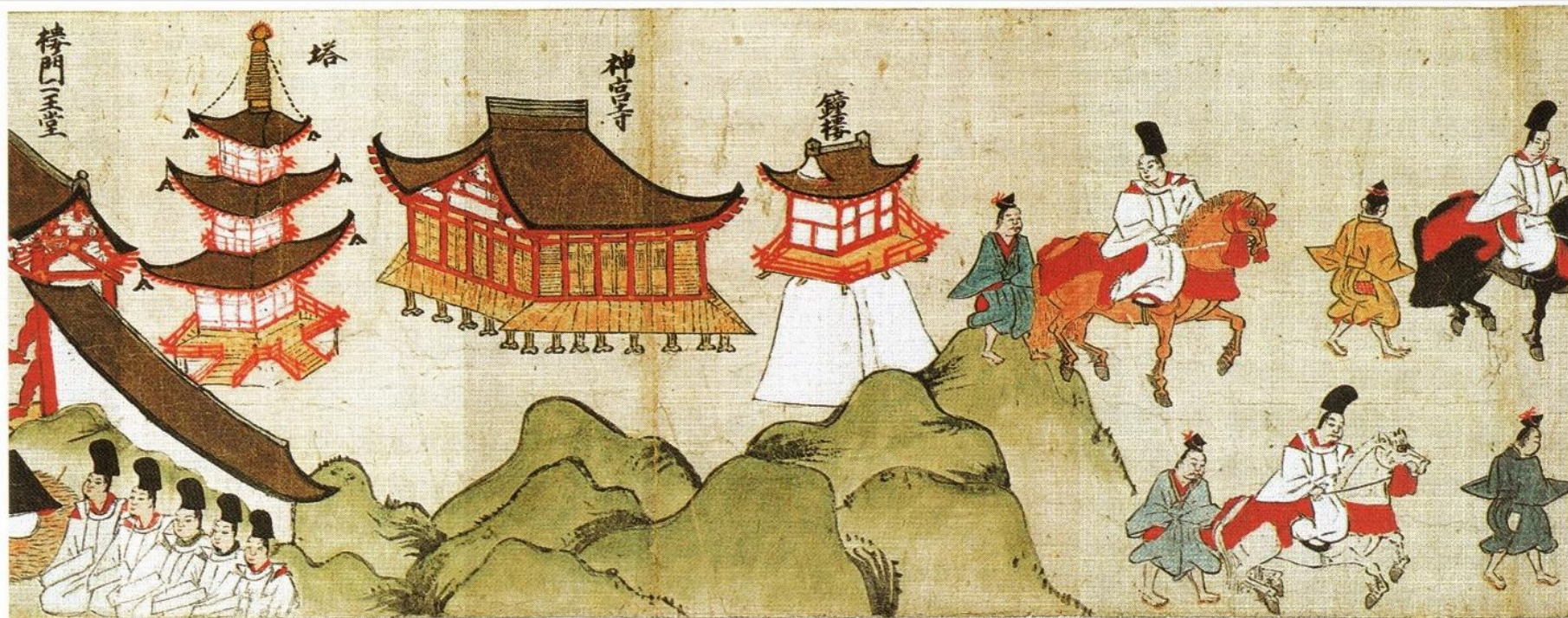
香取神宮神幸祭繪卷(権檢非違使家本)(『千葉県史研究第15号』H19.3)