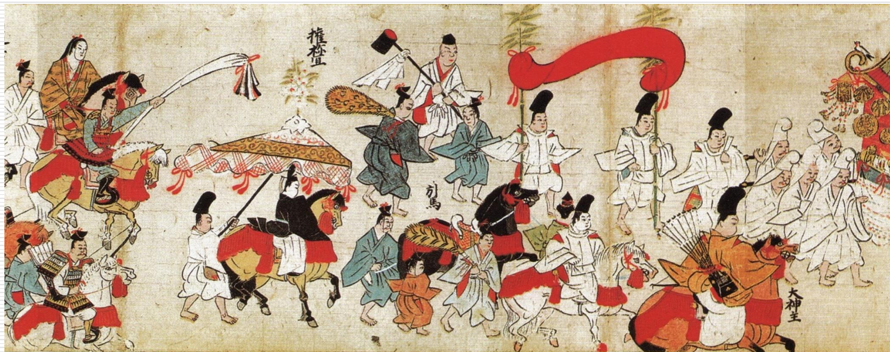
香取神宮神幸祭繪卷(権檢非違使家本)(『千葉県史研究第15号』H19.3)