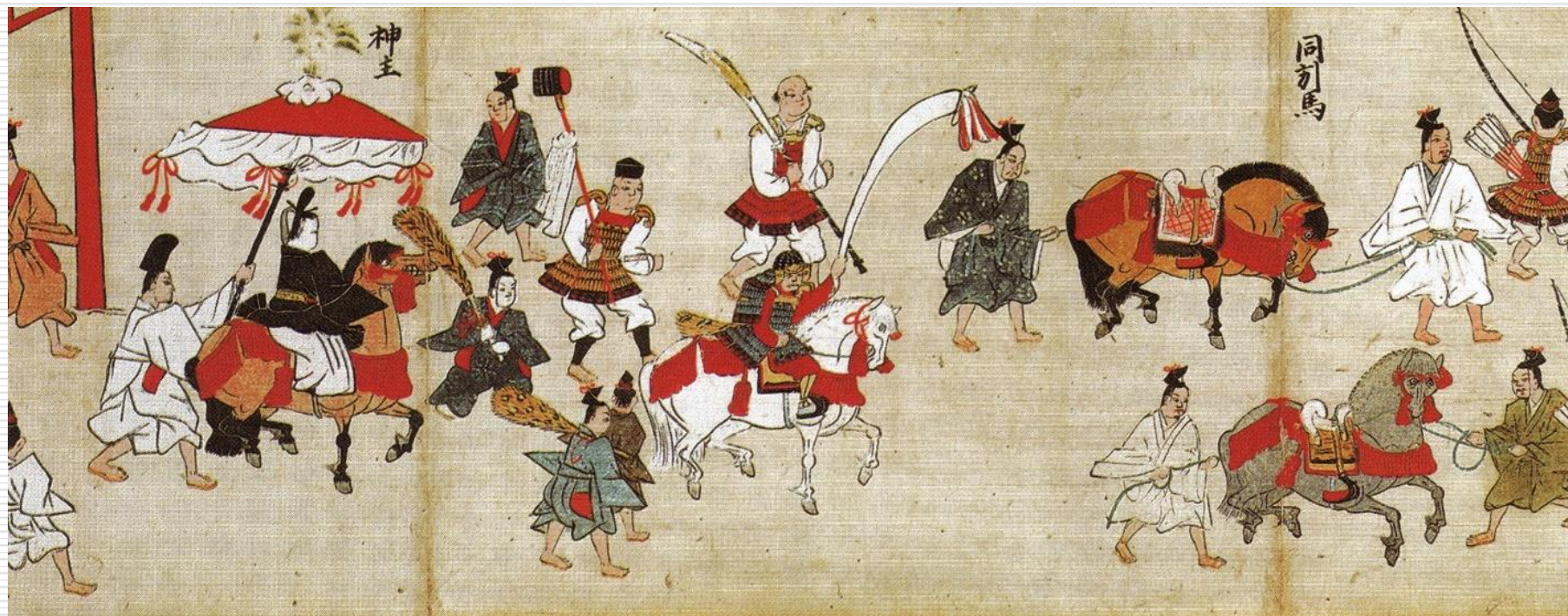
香取神宮神幸祭繪卷(権檢非違使家本)(『千葉県史研究第15号』H19.3)