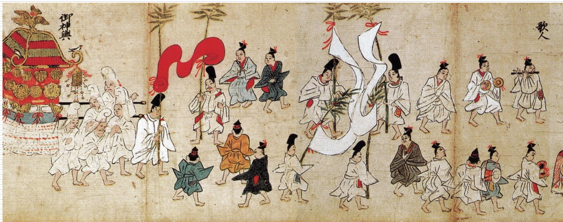
香取神宮神幸祭繪卷(権檢非違使家本)(『千葉県史研究第15号』H19.3)