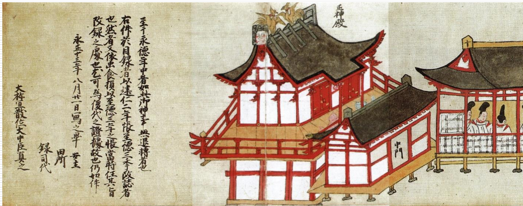
香取神宮神幸祭繪卷(権檢非違使家本)(『千葉県史研究第15号』H19.3)