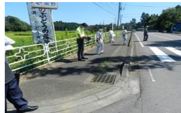
通学路合同点検の様子（令和2年8月20日実施）

香取警察署 千葉県香取土木事務所 香取市土木課 香取市環境安全課 香取市教育委員会学校教育課 各学校の管理職等が危険箇所ので一堂に会し、通学路の危険性や安全対策について話し合いました。