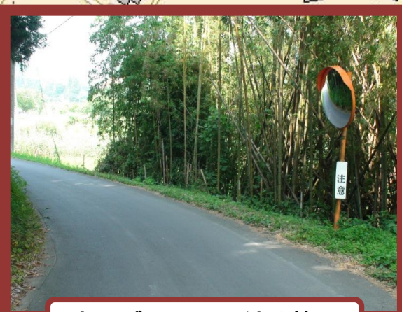
カーブミラーの付け替え