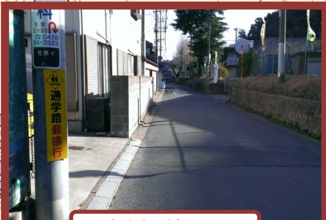
注意喚起看板の設置

★登下校時における通行車両の速度低減につながりました。また、通行する車両数が減少傾向にあります。