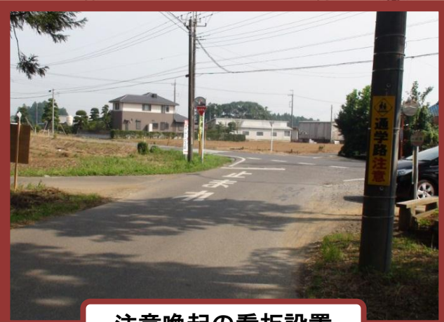
注意喚起の看板設置

★登下校時における通行車両の速度低減につながりました。また、道路横断をしようとしている児童に気付き、停車して安全な横断に協力してくれる車両が増えました。