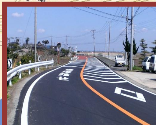
減速マーク、ダイヤモンドマーク等の引き直し