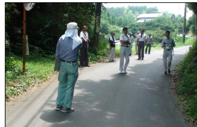
通学路合同点検の様子（平成26年7月14日実施）

香取警察署、千葉県香取土木事務所、香取市道路河川管理課、同環境安全課、同学校教育課、各学校（管理職や保護者）が危険箇所で一室に会し、道路の危険性、安全対策について話し合いました。