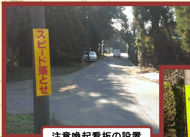
注意喚起看板の設置