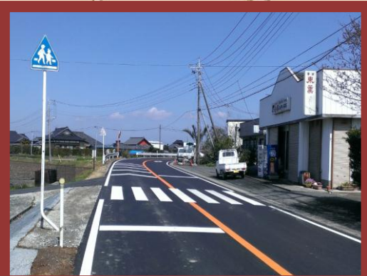
横断歩道の移設と待機場所の設置