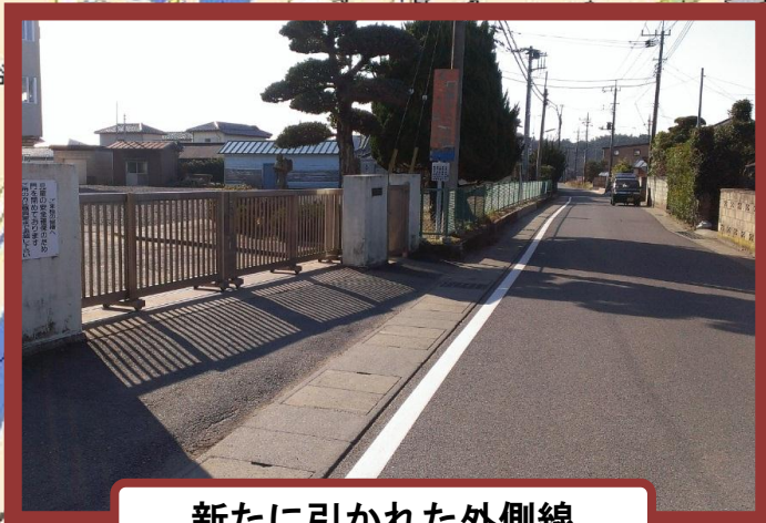
新たに引かれた外側線