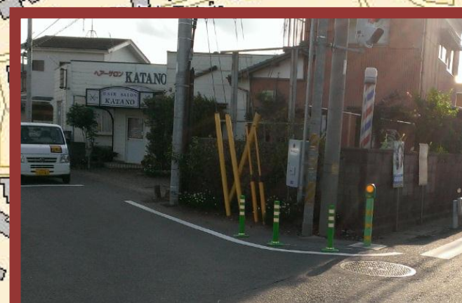
ポストコーンの設置と外側線の引き直し