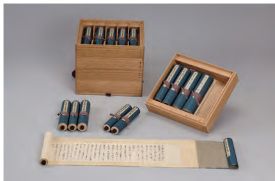
娘宛て伊能忠敬書状