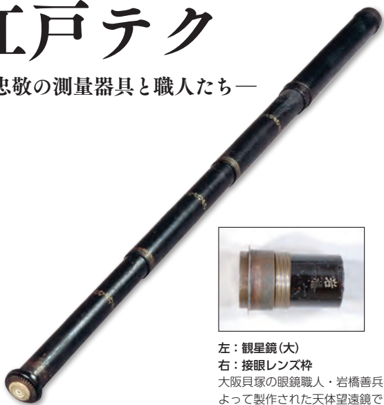
左：観星鏡(大) 右：接眼レンズ枠