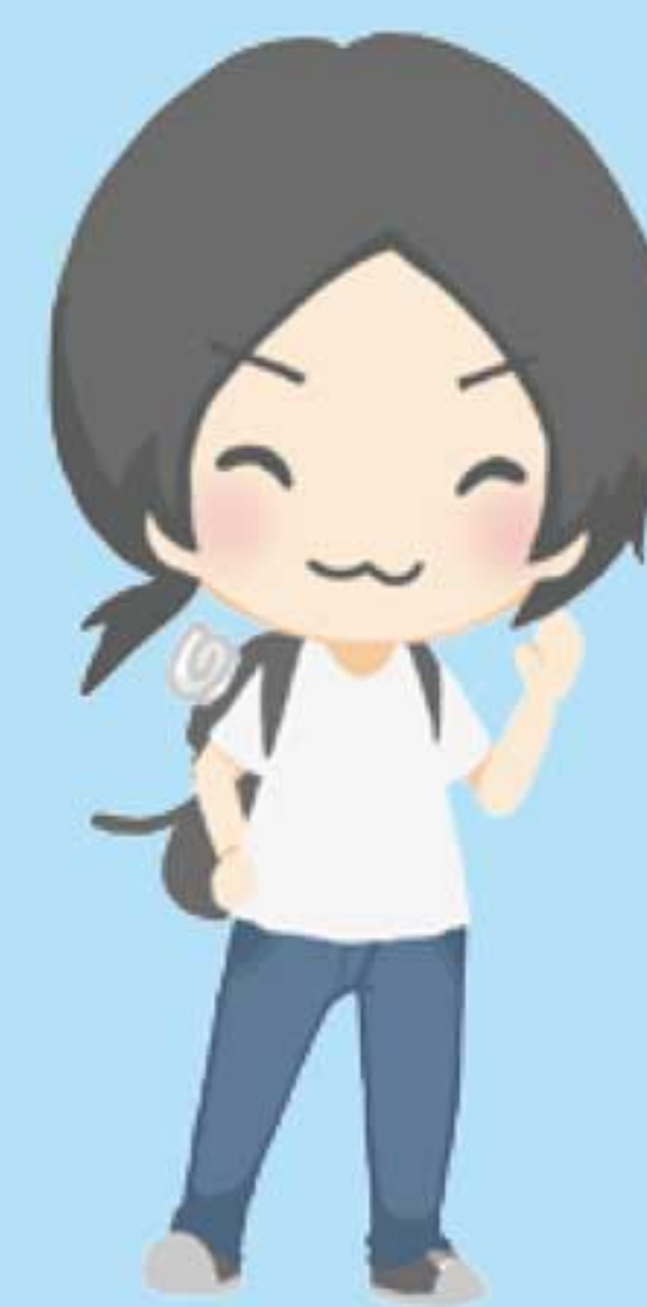
海外からのお客さま

台湾人は日本人に比べて直接物事をいう方が多く、 はっきりと気持ちを示さないと通じない方が多いです。 良いものは良い、ダメなことはダメとはっきり伝えましょう。