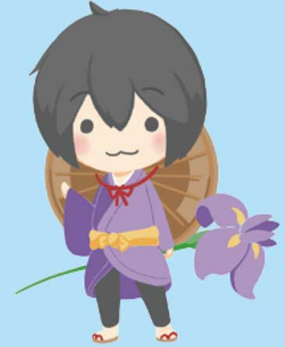
香取市外国人おもてなし BOOK 主人公 かとりあやめ