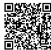
香取市 LINE 公式アカウント