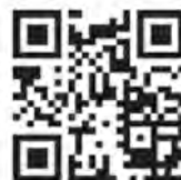
香取市ホームページ