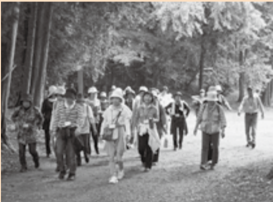
▲健康交流ウォーキング (上：専門講師によるウォーキング教室、下：星宮神社)

せっかくウォーキングをするのであれば、基本から学ぼうと、平成24年から日本ウォーキング協会の専門講師を招き、講演と実技を実施しています。特に歩くスピード、よい姿勢、きれいな歩き方、ウォームアップ、そしてクールダウンのためのストレッチ、靴の選び方、履き方などを学び、講師とともにウォーキングを行います。