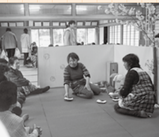
▲ボランティア「サワーズ」が「お花見会」でおもてなし

草刈りボランティア合宿を行っています。草刈りボランティア合宿時には、地元のお宅のお風呂をお借りする、もらい湯などで交流を深めており、廃校となってしまった小学校に、活気が戻ってきています。 11月には地域資源を活かし、手作りの「里山コンサート」も開催しています。 協議会は、地域の皆様にご協力いただきながら活動を進めています。必要不可欠なのは人と人とのつながりだと感じています。 顔を合わせ、声をかけ、心を通わせていけるまちづくりを心掛けていきたいと思っています。