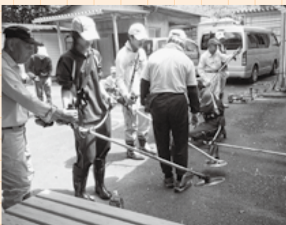
▲草刈りボランティアに草刈り機の使い方を指導