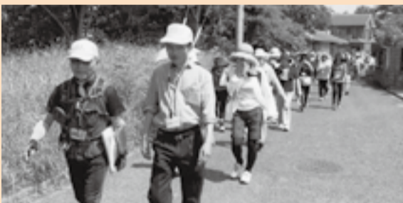
▲瑞穂史跡巡り健康ウォーキング大会

「住んでいてよかった」と思え、また健康増進および住民交流の双方を図れるような行事を考え、「瑞穂史跡巡り健康ウォーキング大会」を開催することにしました。2つのコースと史跡を説明したマップを各戸に配布し、これまで2回実施しましたが、毎回スタッフを含め100名に近い参加を得、程よい汗をかき、皆で健康感を味わいました。