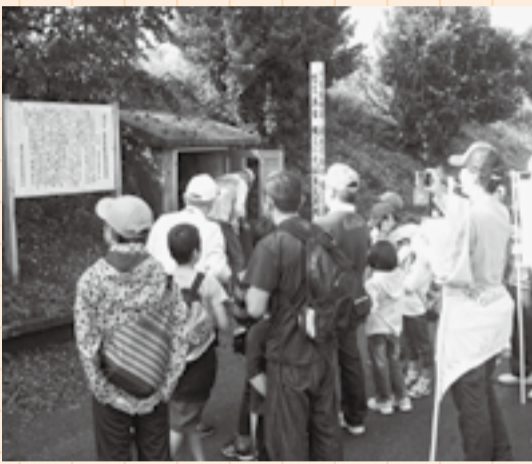
▲良文ふるさとウォーク (上：来迎寺、下：良文貝塚の貝層を見学)

「良文貝塚」、「阿玉台貝塚」をはじめ多くの貝塚などの遺跡や市指定文化財の樹林寺(五郷内)の四季桜、久保神社(久保)の本殿・歴史資料など、たくさんの方の良文遺産があります。