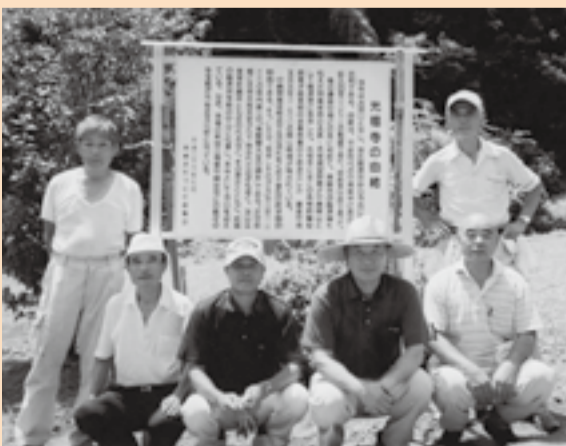
▲史跡案内板を設置

これに併せて「史跡案内板」を3カ所に設置しました。このほか、防災・防犯や、小学生から環境美化の標語を募集しましたが、今後も、地域まちづくり計画の目標「誰もが生涯安心して生活でき、心豊かな瑞穂の郷づくり」に向かって、皆で助け合い、一歩一歩事業を進めていきたいと考えています。