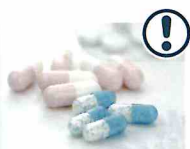
医薬品の多量摂取