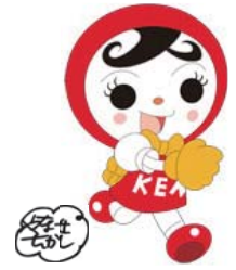
人権イメージキャラクター 人KEN あゆみちゃん