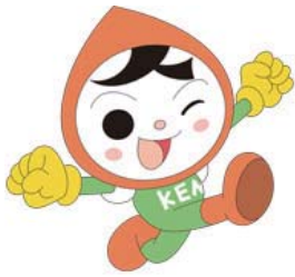
人権イメージキャラクター 人KEN まもる君