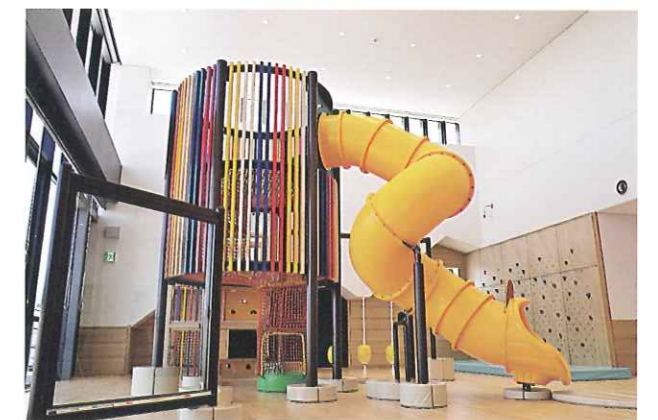
みんなの賑わい交流拠点コンパス内いきいきひろばの大型遊具