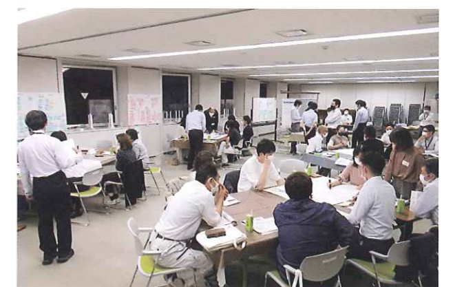
高校生から高齢者まで様々な市民が議論したかとりみらい会議