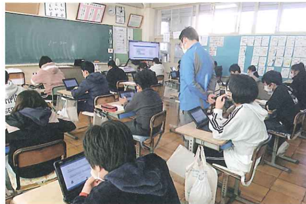
GIGAスクール構想に基づいて整備した、タブレット端末を用いた学習