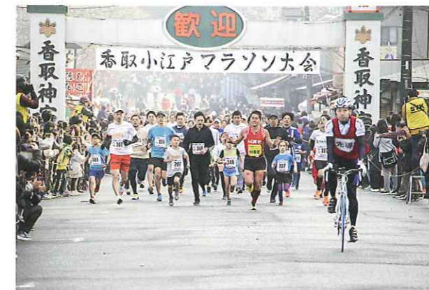
香取小江戸マラソン大会