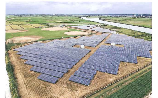
本市が管理する与田浦太陽光発電所