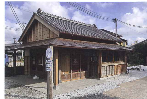
町並みに合った外観に改修され、甍った建物