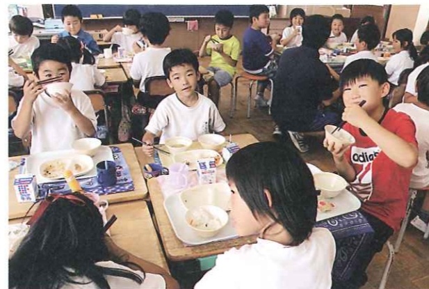
小学校における学校給食