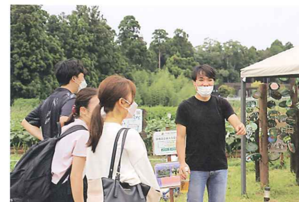
地域おこし協力隊による関係人口拡大の取組