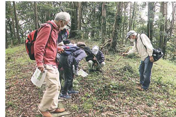
自然観察会の様子