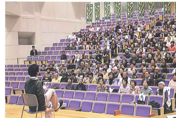
地域サロン等で普及が進む香取もりもり体操