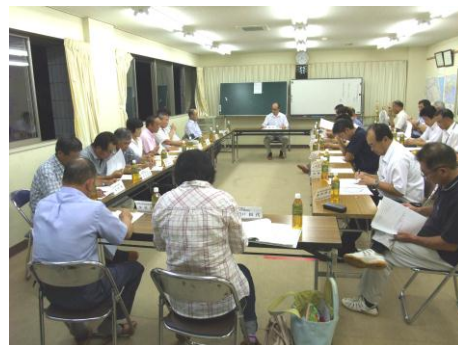
(写真) 平成25年7月24日 地域検討会議

第一山倉小学区でも、保護者の代表者、地域住民の代表者、学校教育関係者で組織する地域検討会議を立ち上げ、 山田地区の小学校の5校を一つに統合することについて、検討協議を始めました。