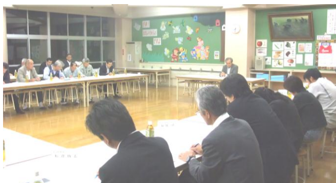
地域検討会議の様子

今後、地域の意見を集約するにあたり、地域説明会を開催することや、アンケート調査を行っていくことが話し合われ、まず、 地域説明会を12月15日（日） に開催（説明会のお知らせをご覧ください）することとなりました。