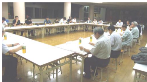
H25. 9. 24 開催 準備会の様子

今後、府馬小学校地域検討会議を設置し、山田地区の小学校5校を一つに統合するという教育委員会からの提案について、府馬小学区としての意見を取りまとめることとなります。