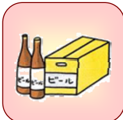
町内会の集会や旅行などの催物への寸志や飲食物の差入