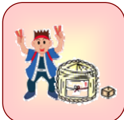
お祭りへの寄附や差入