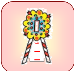
落成式・開店祝の花輪