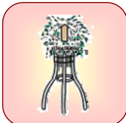
葬式の花輪・供花