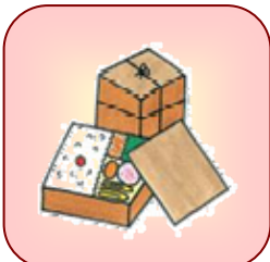
地域の運動会やスポーツ大会への飲食物の差入