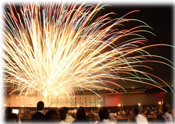
水郷おみがわ花火大会