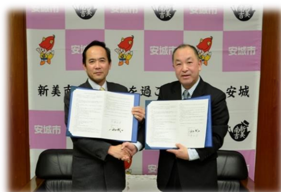
愛知県安城市 災害時相互応援協定（平成25年2月1日）