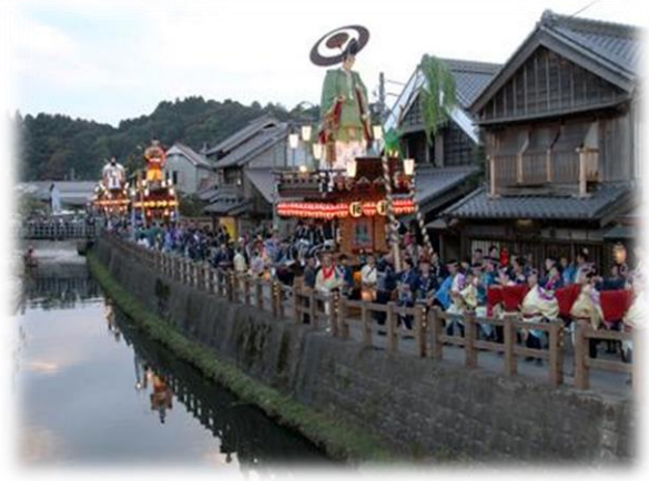
佐原の大祭秋祭り