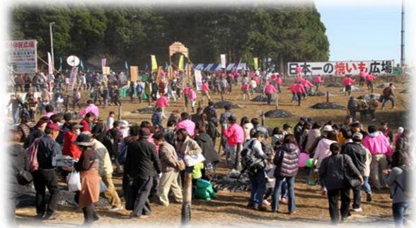
栗源のふるさといも祭