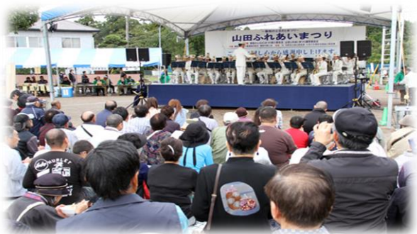
山田ふれあいまつり