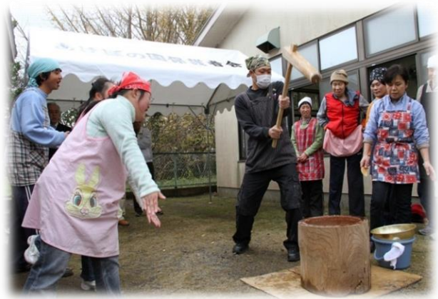
あけぼの園もちつき会

障害者等の地域の実情に応じ、創作的活動又は生産活動の機会を提供する施設、または、送迎を実施する施設に助成を行い、在宅の障害者の社会参加を促進する。