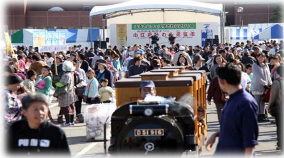
ふるさとフェスタさわら

11月に地域ごとに開催されているイベントを「香取のふるさとまつり」と位置づけ、香取市全体として農産物・特産品や文化資源などの魅力を市内外に発信する。