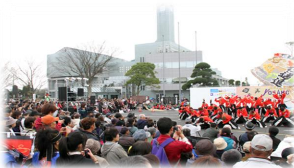
おみがわYOSAKOIふるさとまつり