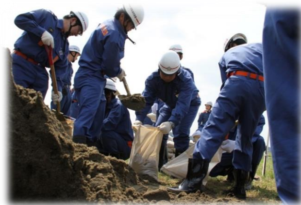
香取市消防団水防訓練