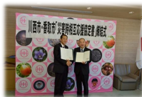
兵庫県川西市 災害時相互応援協定（平成25年11月22日）