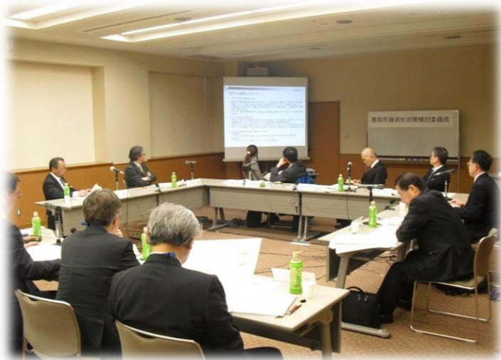
液状化対策検討委員会