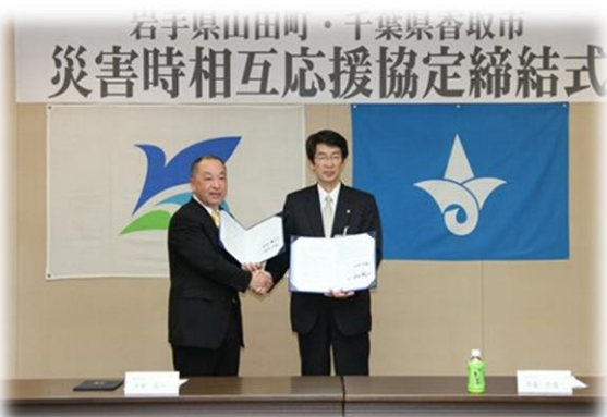
岩手県山田町 災害時相互応援協定（平成25年3月15日）