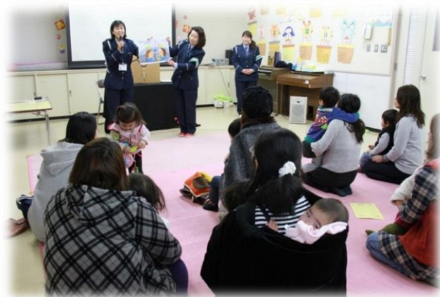
山田児童館交通安全教室