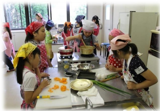
山田児童館（料理教室）

児童館に児童厚生員を配置し、児童館の使用を通して児童の健全育成を図ることともに、健全な遊びを通じた児童の集団的、個別的指導及び児童の福祉を目的とする行事を行う。