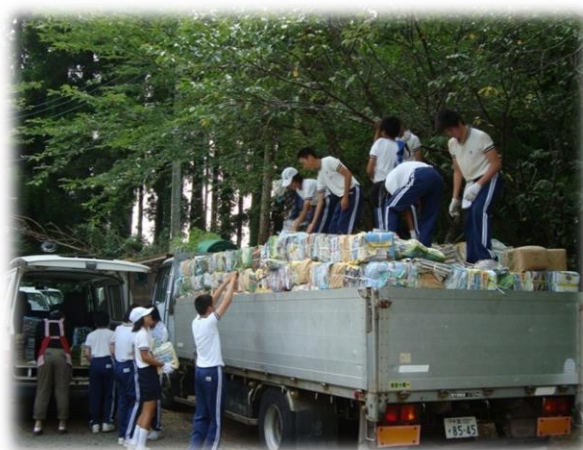
栗源地区住民自治協議会 集団資源回収