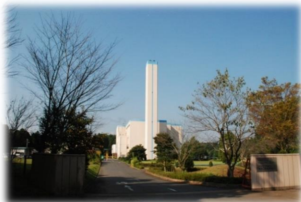
伊地山クリーンセンター

一般廃棄物(ごみ)処理業務を円滑に遂行するため、ごみステーション整備補助金の交付、埋立ごみ処理委託、ごみカレンダーの印刷等を行う。