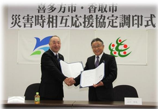
福島県喜多方市 災害時相互応援協定（平成24年10月13日）

水防事業 2,895 千円 土木課 水防法に基づく水防事務。 香取市水防計画に基づく水防活動及び水防施設の管理を行う。