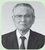
瑞宝双光章 高齢者叙勲