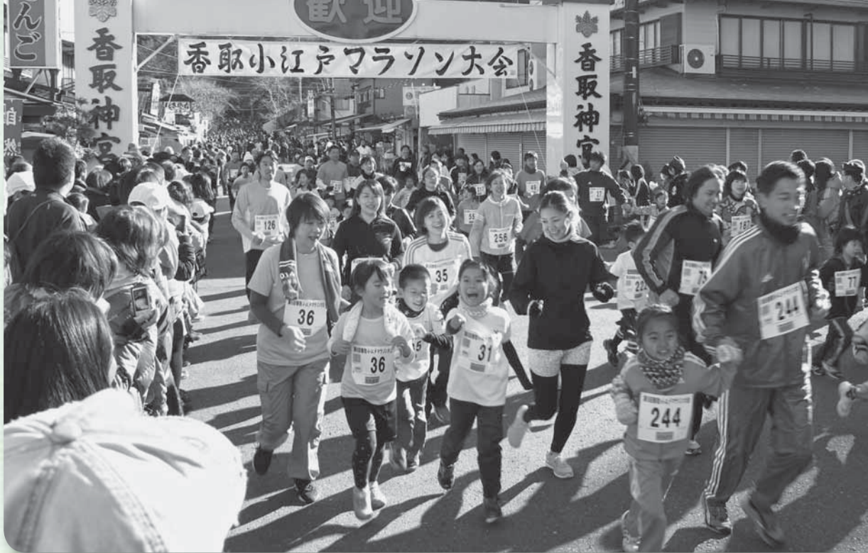
▲大勢の観客の中、家族の声援にパワーアップ（2km親子）