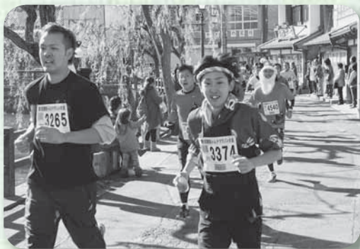
▲小野川沿いを駆け抜けるランナー（10km）