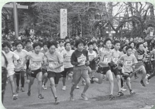
▲号砲とともに勢よくスタート （2km小学4年～6年）