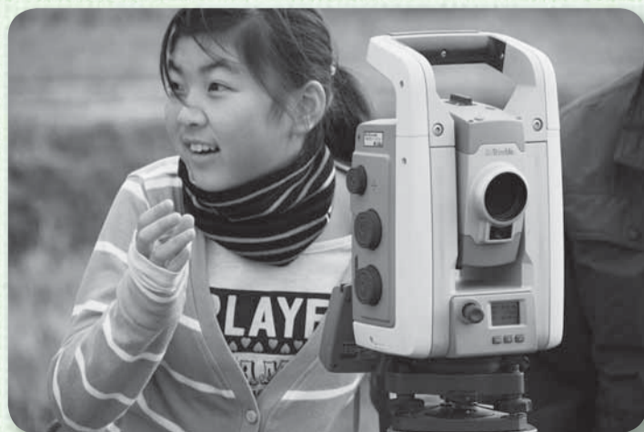
▲「よく見える！」光波測距儀に大興奮

工事や測量、農業に使用するさまざまな機械を操作したり乗車体験したりした子どもたちからは「操作を覚えると簡単だった」という頼もしいコメントが聞かれました。その他に鯉やどじょうの放流も行われ、魚を手でつかんだ感触に「ぬるぬるする～！」と大はしゃぎでした。