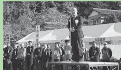
▲香取小江戸マラソン大会