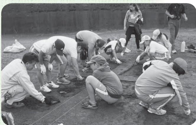
▲土器発掘に夢中になる児童たち

小見川西中学校跡地で行われている石仏遺跡発掘調査の現場を9月10日、小見川西小学校の児童34人が訪れ、奈良・平安時代の住居跡に眠る土器の発掘を体験しました。発掘する前に現場調査担当者の住居跡の説明を聞いて進んでメモを取る姿もあり、この体験に対する関心の高さがうかがえました。