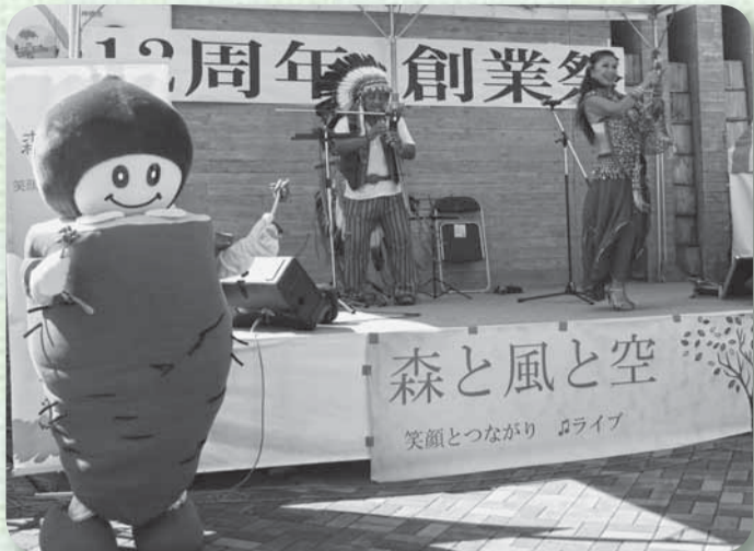
▲陽気な楽曲で会場を盛り上げたアンデス民族楽器演奏グループ