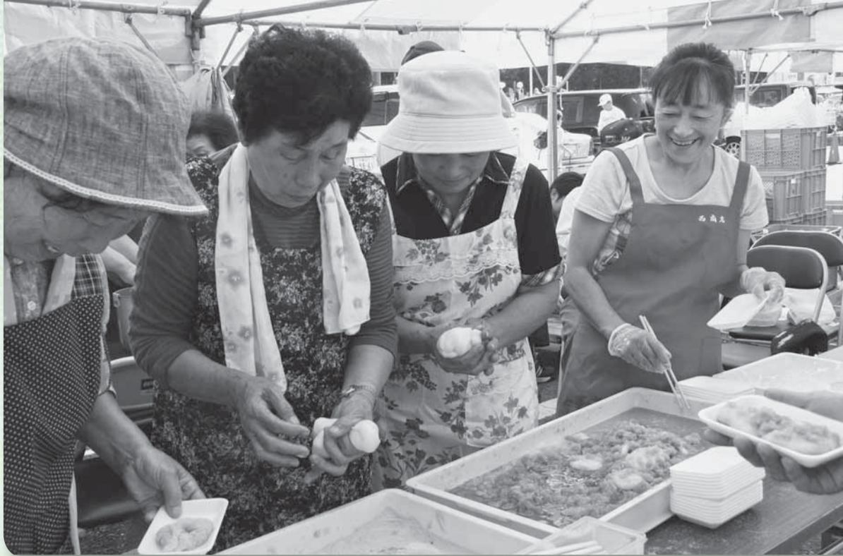
▲おもちの人気ぶりに米部会スタッフもいきいきと販売！