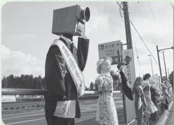
▲今年の最優秀作品が決定（かかし祭りコンテスト）