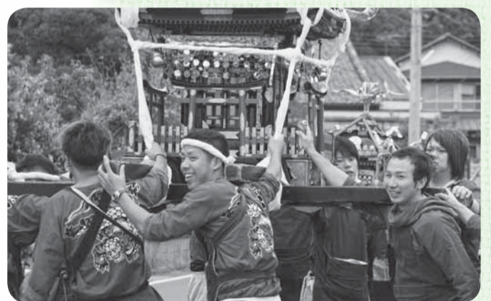
▲一致団結してみこしを担ぐ青年団（8日）