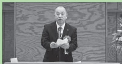
▲佐原地区敬老会・金婚祝賀会