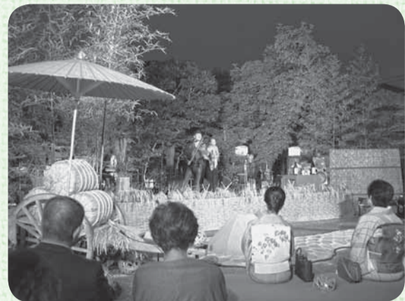
▲月夜に響く哀愁を帯びた音色に魅了

宴は夕刻の落語から始まり、バイオリンや尺八の演奏などが披露され、月の光を浴びながら幽玄ではかなげな曲に観客はうっとり聴き入っていました。