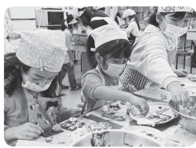
▲本命も友チョコもかわいくなっちゃ

2月14日のバレンタインデーを前に「バレンタインチョコづくり」が、山田児童館で行われました。 この日は、女子児童20人が参加し、クリスピーチョコとデコチョコを作りました。溶かしたチョコレートで絵や文字を書いたりして、かわいくデコレーション。家族や友達へのメッセージを添えて、リボンなどでラッピングし、愛情いっぱいチョコを完成させました。