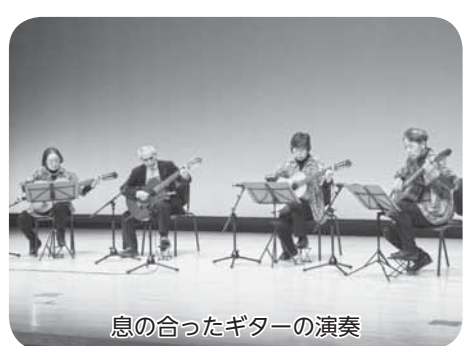
息の合ったギターの演奏