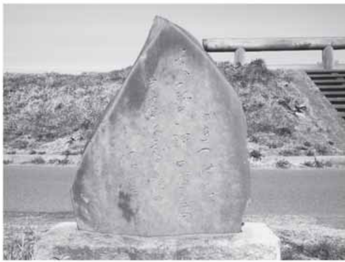
▲与謝野晶子の短歌碑(津宮)