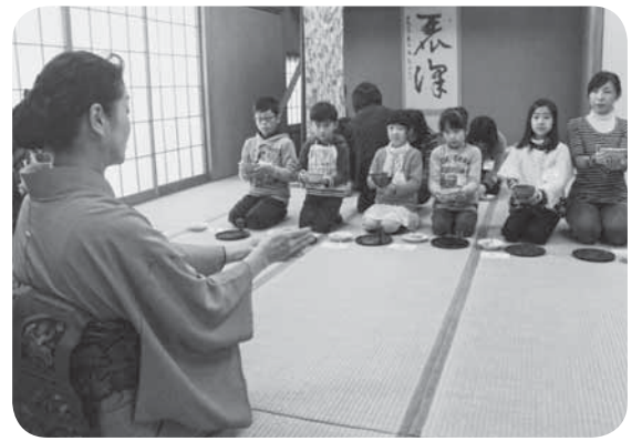
▲作法を身に付けて姿勢も良くなりました

学習。参加した子どもたちはお茶会の前につくった3色だんごと、自分でたてた抹茶をいただき「どっちもおいしかった」と感想を話してくれました。