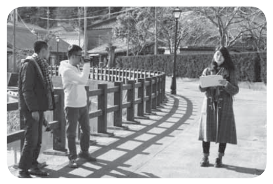
▲撮影は小野川治いなどで行われました

神田外語大学と、タイ、中国、インドネシアの大学生82人が参加した「d'CATCHプロジェクト」が市内で行われました。