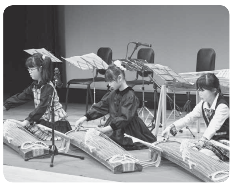
▲かわいらしい琴の演奏