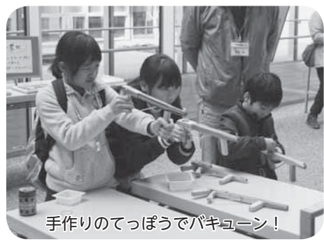
手作りのてっぽうでパキュン!

生涯学習の活動の紹介や世代間の交流、また伝統文化の継承により、新たな文化の創出を目的とした生涯学習フェスティバルが、小見川市民センター「いぶぎ館」で開催されました。 ダンスや花笠音頭、太極拳の演舞、琴の演奏などのさまざまなステージ発表があり、各団体が日頃の練習の成果を披露しました。 また、市民ギャラリーでは、人材バンクいろいろ体験フェアも開催され、多彩な特技を持ったボランティアの皆さんの指導により、参加した多くの子どもたちは昔遊びや自然小物づくりなどを体験しました。