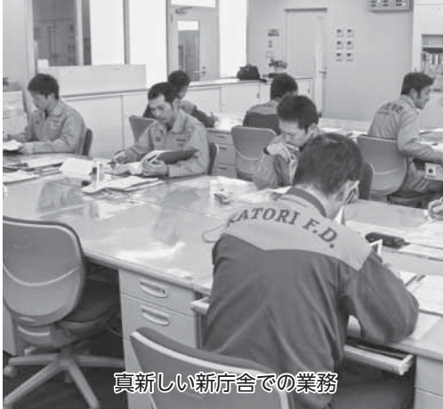
真新しい新庁舎での業務

4月1日(火)から香取広域市町村圏事務組合消防本部が新庁舎3階へ移転し、佐原消防署と一体となって業務を開始します。