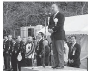
▲香取小江戸マラソン大会