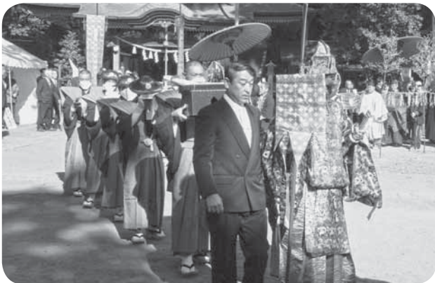
▲古式ゆかしい整然とした行列

栗山川に遡上してきた鮭を奉納する「山倉の鮭祭り」が、山倉大神で執り行われました。猿田彦の面をつけた氏子らを先頭に、神職らが行列を組みながら進み神前に鮭を供えました。また、護符として「病氣や災いをサケる」と珍重されている鮭の切り身が参拝者に配られました。夕方からは、若者たちによる威勢の良い神輿渡御が行われ、厳かな祭儀から一転、にぎやかな雰囲気になりました。