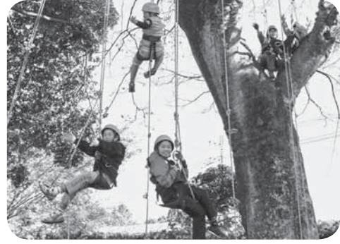
▲小春日和の中、楽しむ子どもたち

インストラクターを招き、6人の子どもたちが旧沢小学校のエノキの木でツリークライミングを体験しました。