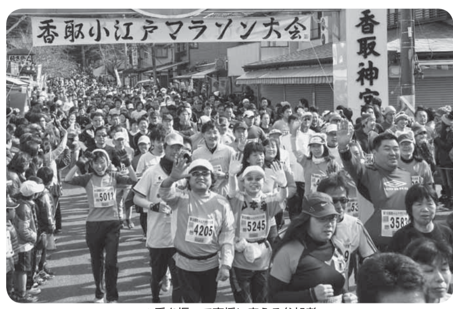
▲手を振って声援に応える参加者

さんは、一緒に走ったり、ものまねを披露するなど、大会を盛り上げました。また会場では、ふかしいもや豚まんが振る舞われ、参加者や応援に来た人のお腹を満たしました。