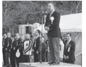
▲香取小江戸マラソン大会