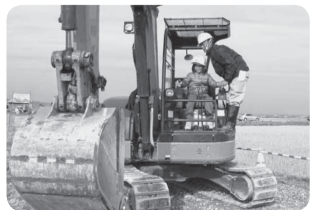
▲私のバックホウさばき、なかなかでしょ！？

府馬・八都・小見川南学校の児童61人が参加した農業・建設機械の体験学習が、府馬地区の水田区画整理工事現場で行われました。香取農業事務所や建設会社などが、子どもたちに土地改良事業を理解し、農業・建設業に親しみを持つってもらうため企画され、自らの手で行う農業・建設機械の操作や魚の放流などの貴重な体験に、子どもたちは歓声をあげていました。