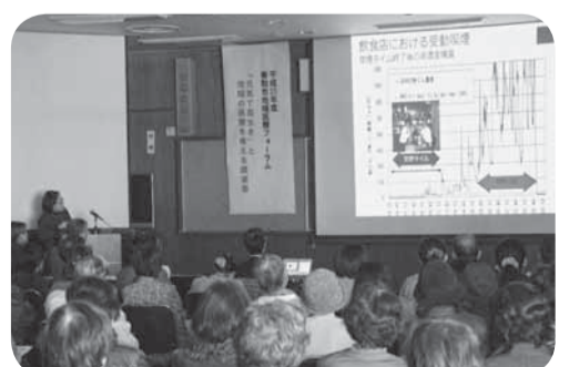
▲テーマは「たばこの受動喫煙」

住民、医療関係者、行政の連携の強化を目的とした「地域医療フォーラム」が佐原中央公民館で開催されました。