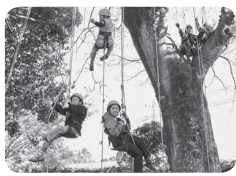
▲小春日和の中、楽しむ子どもたち

インストラクターを招き、6人の子どもたちが旧沢小学校のエノキの木でツリークライミングを体験しました。