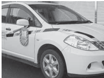
自動車の差し押さえ