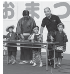
▲黒部川イルミネーション点灯式