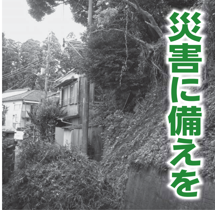
▲平成19年、台風20号によるがけ崩れ（平台地区）