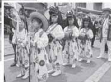
▲佐原八日市場の獅子

獅子舞といっても、実にさまざまな獅子舞があります。赤い顔をした獅子頭に前足役と後ろ足役の二人立ちのものや、獅子とはいいなながら、角を付けた獅子頭を一人で被る一人立ちのものなどです。民俗的には、前者は大陸から渡ってきた伎楽系の二人立ち獅子舞、後者は村などに害をなす災いを祓うために行われた風流系の一人立ち獅子舞とに区別しています。